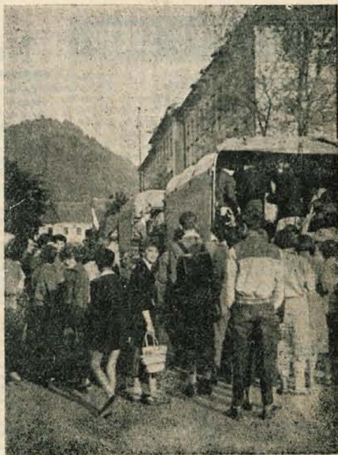
V soboto zjutraj je kranjska mladina odšla na dvodnevni pohod po poteh brigade »Franceta Prešerna«; to brigado, ki slavi letos 15. obletnico ustanovitve, so v glavnem sestavljali borci z Gorenjske. Sobotni in včerajšnji pohod je priredil mladinski odsek Planinskega društva Kranj.

V tem tednu bo mladina, ki končuje obvezno šolanje, skupinsko obiskovala tovarne, obrtne delavnice, gradbišča, vzorna kmetijska posestva, kar naj bi ji olajšalo odločitev za vstop v ta ali oni poklic.