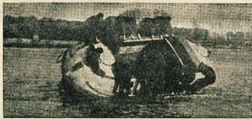
Strokovnjaki se na moč trudijo, da bi izboljšali ladijske reševalne naprave, ki v nesreči pogosto odpovedo. — Naša slika prikazuje Nicolov rešilni čoln, ki meri v dolžino 6,5 m in sprejme 24 oseb. Grajen je v celoti iz aluminija, kar mu daje izredno trdnost in zmanjšuje nevarnost poškodb ob udar-cih pri spuščanju. Čoln je na vodi zelo stabilen, ker ima težišče zelo nizko, zato se čoln praktično sploh ne more prevrniti. Čoln se premika s pomočjo vijaka, ki ga z nogami poganjajo pet-niki.