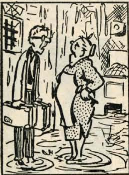
Podnajemnik: »Ampak, saj sobo vseh strani zamaka. Saj bom komaj brodil...«