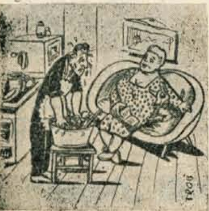
No, vidiš, pa si dejal, da ne bo šlo brez služkinjel!