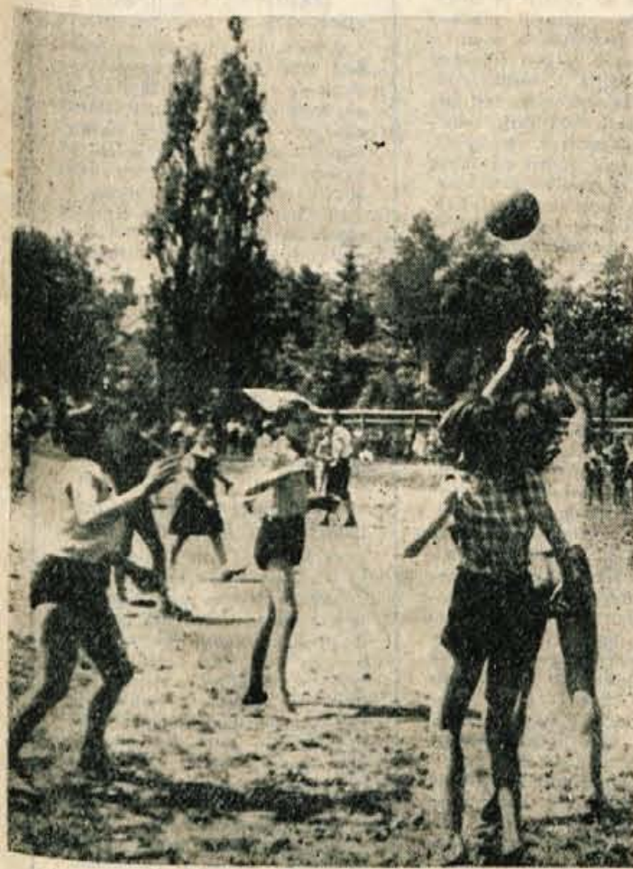
Starešinski svet osemletke »Simon Jenko« v Kranju je v počastitev Dneva mladosti 24. maja dopoldne priredil športna tekmovanja v raznih disciplinah. Zmagovalne ekipe so prejele nagrade Starešinskega sveta osemletke »Simon Jenko«. — Naša slika prikazuje igre med dvema ognjema, ki so jo odigrali gojenci osemletk »Simon Jenko« in »France Prešeren«.