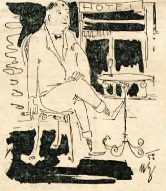
Kaj ne vidite, da se vse draži? In obveže do skupnosti in režijal in, in...

Približuje se sezona in delovni človek se pripravljaja na oddih. Pregleduje in razmišlja, kam bi šel. Poznamo se za cene in ostrimi: 1500 do 1900, 1400 do 1750 itd., itd. Ljudje protestirajo. Časopisi pišejo o tem. Gostinci pa: mar naj delamo čudeže?