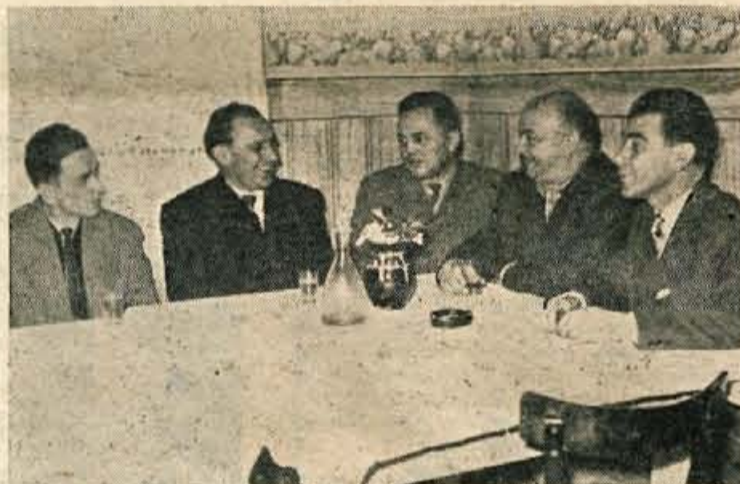
SREČANJE JE VEDNO LEPO IN ZANIMIVO