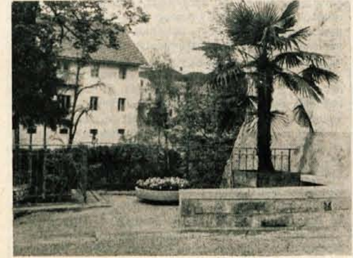
Skofja Loka. — Razvaline so pospravili, prostor pa preuredili v hčen nasad. — Zares, zelo učinkovit »obračun«!