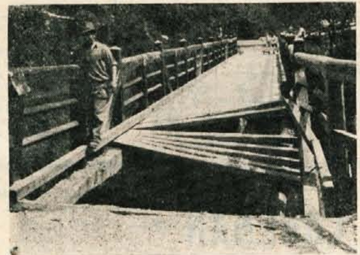
Tak je bil most v soteski Kokre v Kranju potem, ko so izvlekli tovarnjak

v Britofu pa podirati. No — ogledjmo si oba »kamna spotike!«