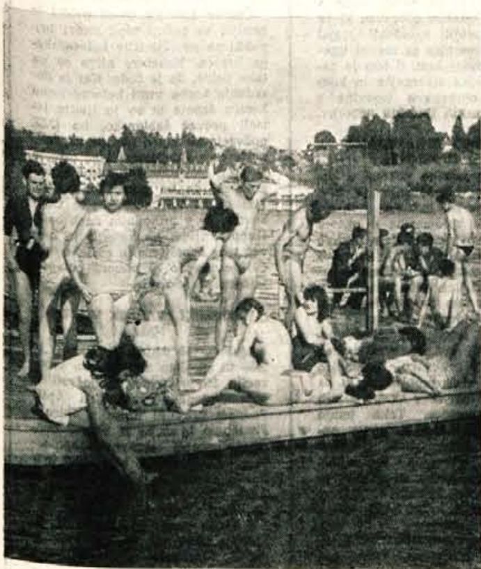
Tako je bilo prejšnja sredo na Bledu