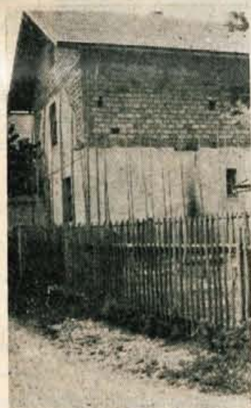
Kalvarija v Kranju. — Prav na tem mestu je nekdo visela razbita tabla

Zdaj pa skočimo v Lesce! Tudi tod smo se pred časom spotikali... Prvi pogled je bil namenjen poslopju, pod čigar streho domuje poštni urad. Nekaj časa sva s Francetom strmela v poslopje, nato pa sva se kislih obrazov spogledala.