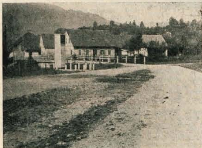
Spomenika padlih borec v Struževem poslej promet ne bo več ogrožal

racije so namreč pred časom spremenili v zanemarjeno prenočišče, kjer je domovalo nekaj delavcev tamošnje Komunale. Kuhinja sva sicer našla, ne pa nekdanjih stanovančev, ki so se, kot sva izvedela, že tedaj po objavi »kamna spotike«, izselili. Kuhinja bo urejena do 1. junija, ko bo otvoritev kopalnice, trenutno pa služi kot shramba za barve, lake in razno orodje. — Tudi v tem primeru je zritika v časopisu opravičila svoje poslanstvo.