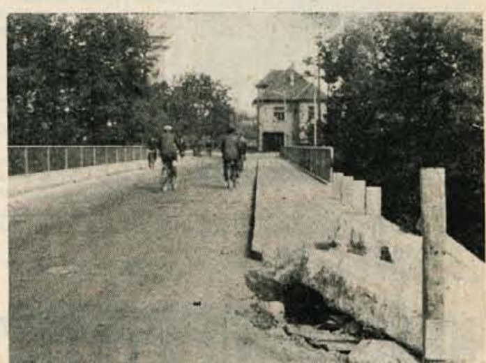
Most čez Kokro na Primskovem v Kranju. — Prav na pločniku je stal bunker, čigar razvaline te dni pospravljajo

Zdaj si pa ogledjmo še tisto »onega«, ki leži nedaleč od tod v Britofu in čaka na porušenje. To so namreč razvaline Celarjeve hiše, ki je nekako pred tremi leti pogorela. Pogorišče je pred kratkim odkupil tukajšnji domačin