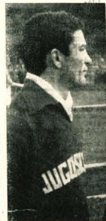
»Seki« — mojster nogometa

ostali reprezentanti proti Planiki iz Kranja, ki se je mnogo bolje upirala nogometnim asom in zgubila le z 0:6.