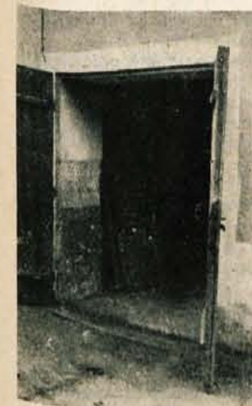
V tej veži je več mesecev domoval delavec Jože Lovrek. Stanovanjska stiska zares ne pozna šale!