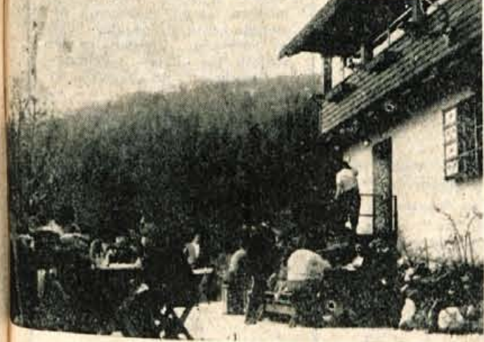
Mnogi izletniki iz Kranja in bližnje okolice so na 1. maj obiskali izletniško točko Mohor nad Bašljem pri Preddvoru.