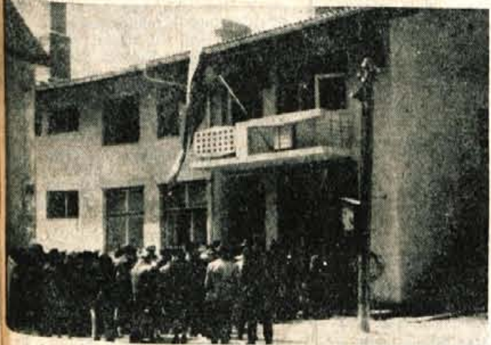
Tržič je 1. maj proslavil s pomembno delovno zmago. Nad 100 občanov je prisostvovalo slovesni otvoritvi nove, moderno opremljene pekarnice.