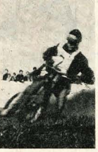
V soboto je bil prvi Hartel

ODRED LJUBLJANA : JES-NICE 50 : 29 (23 : 14) — članice MALI ROKOMET SLOVAN : MLADOST 11:2