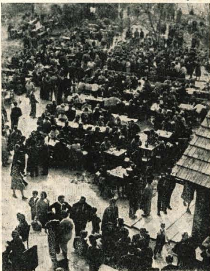
Tisti Kranjčani, ki se nikakor niso mogli odločiti za daljše izlete, so 1. maja obiskali Smarjetno goro. Od ranega jutra do pozne večera je bilo po poteh, ki vodijo proti vrhu in po sončnih pobočjih živahno vrvenje. Kako je bilo na vrhu, vam pa dovolj zgovorno pripoveduje naša slika.