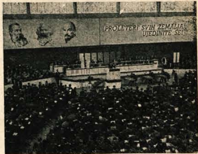
Ne samo delegati, ampak gostje v dvorani, marveč vsa domovina in tudi ostali svet je prisluhnil besedam tov. Tita.