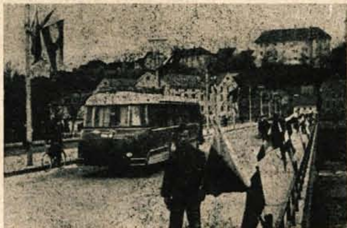
Kranj v prazničnem razpoloženju

Bledu. Malone ni hiše, bivališča, kjer bi stanovalci ne dali duška razpoloženju vsaj z majhnim, skromnim znakom velikega pričakovanja; z zastavicami, smrekovim zelenjem ali prvim pomladanskim cvetjem, ki so ga namestili na okno.