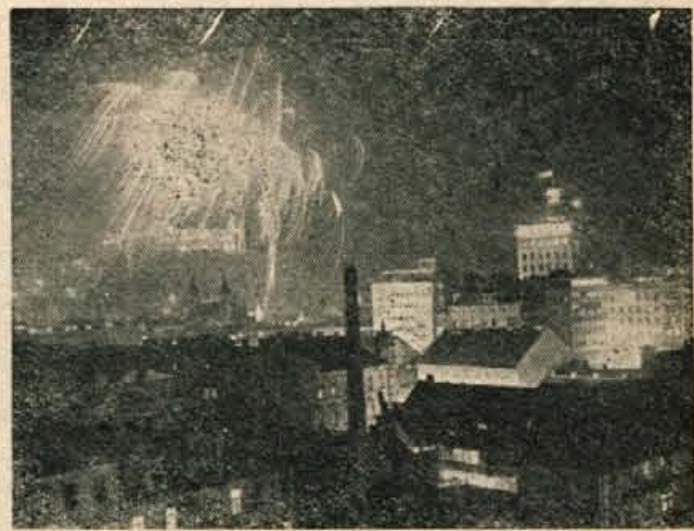
V ponedeljek zvečer je Ljubljana zažarela v siju ognjemeta z Gradu. Slovenska metropola, urejena lepo, kakor še nikoli, je pozdravljala VII. kongres Zveze komunistov Jugoslavije.