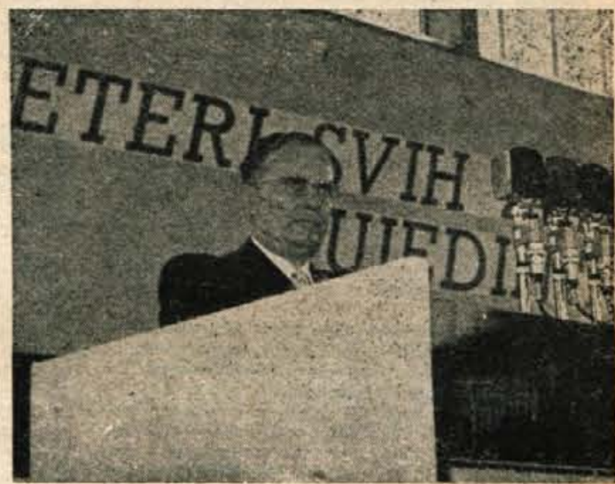
Kongres se je začel v torek dopoldne v veliki dvorani Gospodarskega razstavišča. Uvodni referat — naloge ZKJ v zvezi z mednarodnim položajem in notranjim razvojem socialistične graditve Jugoslavije — je imel generalni sekretar ZKJ tov. Josip Broz - Tito, burno pozdravljen od 1800 delegatov ter številnih goslov.