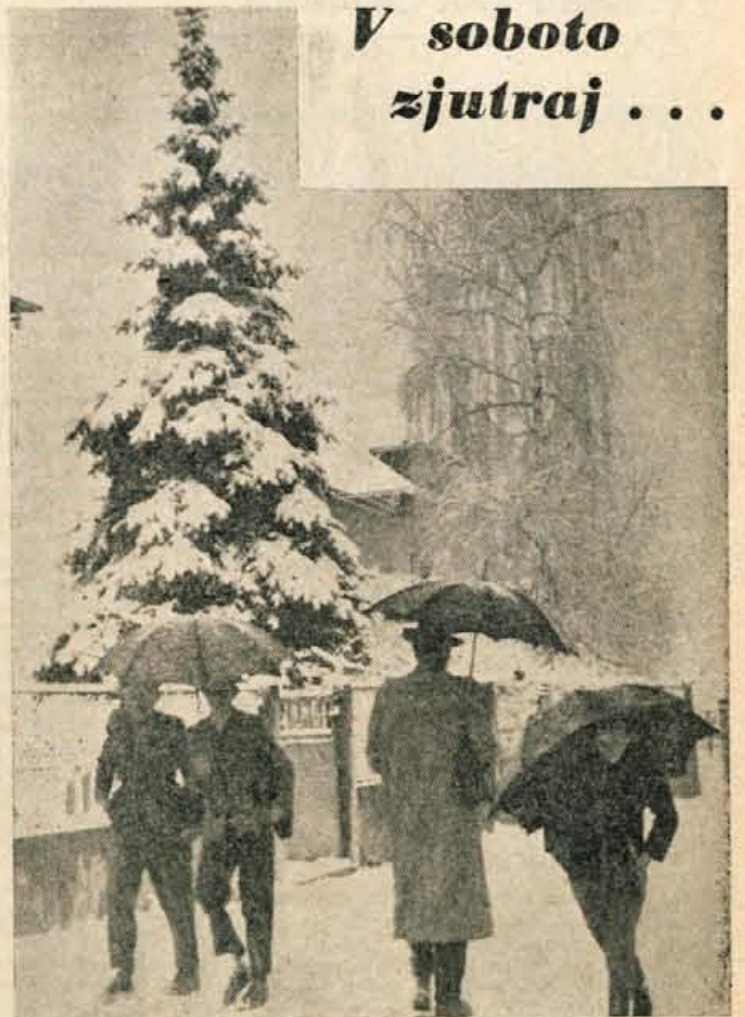
... nas je spet presenetil sneg. April je res nepopoljšljiv.

Razen tega bodo po vseh krajih še razne druge svečanosti — koncerti, športna tekmovanja, povorke itd., ponekod po hribih pa bodo kurili kresove.