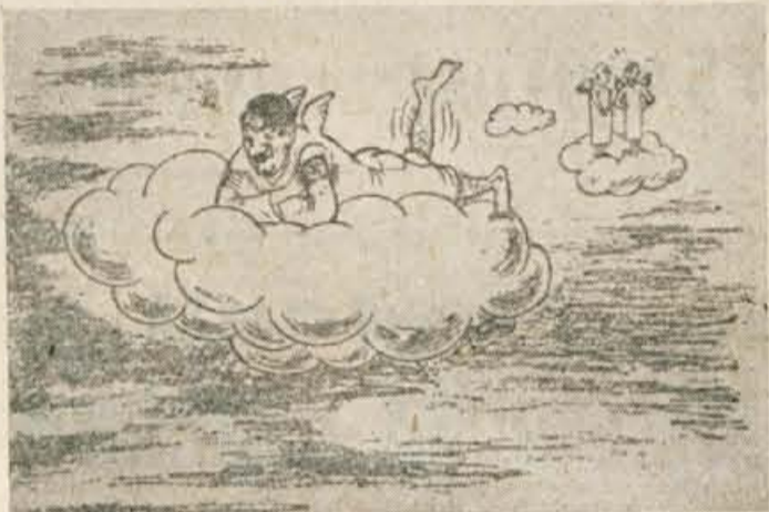
ODKAR JE IZVEDEL, DA NAMERAVAJO OBOROŽITI NEMCE Z ATOMSKIM OROŽJEM, JE DOBIL STRAŠNO DOMOTOŽJE...