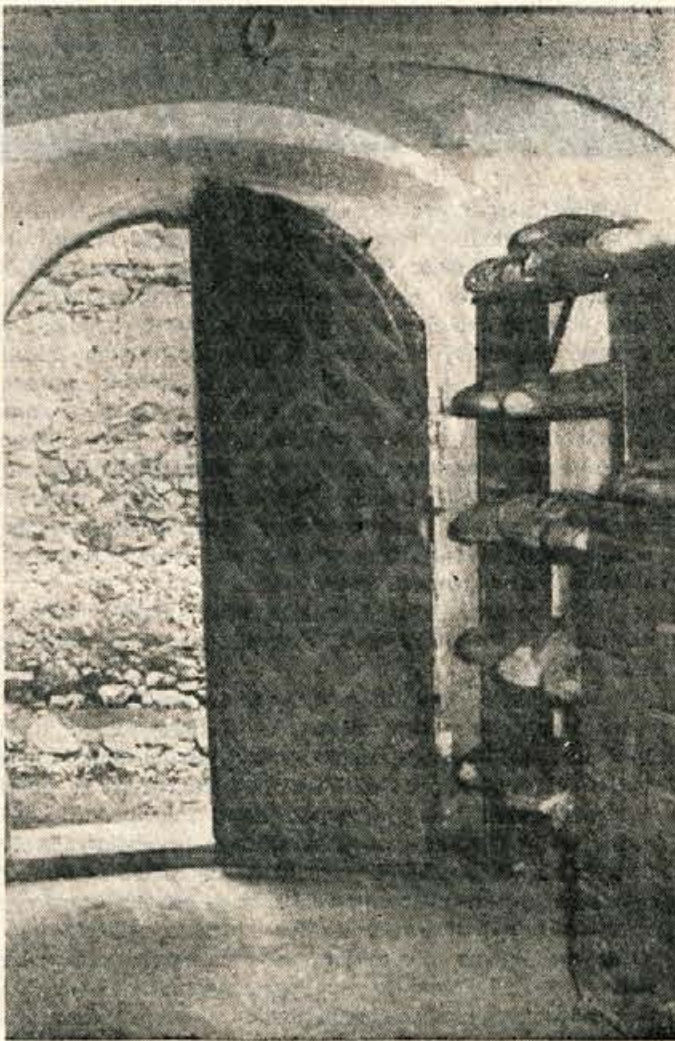
Romantika v Kamni gorici, ni na pravem mestu

Poldne je bilo že odzvonilo — čutiti je bilo to tudi v želodcu. Toda namesto da bi šli v gostilno na zrezek, smo se napotili k njegovemu izvoru — v klavnico Lesce, ki zalaga tudi vso Radovljico in okolico z mesom. — Upravnika ni — je v zadregi pravila prijazna žena in pokazala predelovalnico, klavnico in druge prostore. Kdo naj bi verjel, da se iz teh lukenj vsak teden razpošlje kakih 2000 kg mesa in še več. Toda stiska za prostor še ni najhujše zlo. Tik ob vratih klavnice je neke vrste gnojna jama, kamor mečejo odpadke. K sreči je bilo tiste dni še mrzlo, oziroma deževno. Kak duh in paša za muhe mora biti tam ob vročih poletnih dnevih! Hiteli smo od tam, da ne bi zgubili apetita do zrezkov, pa se nam je nudil že nov prizor. Mesar v klavnici je iztrebljal iz črevesja zaklane višče živine blato kar z raven kosov mesa, v podstavljeni posodi, vendar je brizgala nesnağa — vsaj videti je bilo tako — na vse strani in lahko tudi na meso, viseče ob strani. Odrekli smo se kosilu in zrezkom in hiteli proti Kranju.