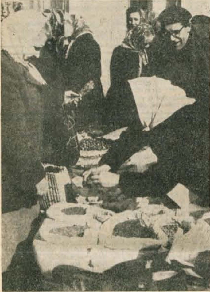
Pri prodajalkah semena je v teh dneh na trgu največ kupcev

so skozi okna kukale glave in »študirale« vreme, čimbolj pa se je kazalec pomikal proti devetim, tembolj je bilo. Ulice so se izpraznile, skoro nisi več videl človeka, le neprijetne luže so se lesketale po cestnem tlaku.