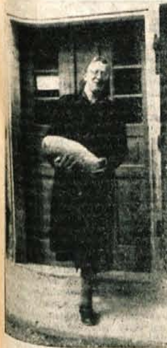
Zakaj ga ne zavijete!

Ena od trgovin v Kropi je bila zaprta. »Inventura je,« je povedal deček, toda »Kropa ima še eno trgovino,« nam je ta mladi prostovoljni vodič vedel takoj pojasniti. Sicer pa pojasnilo niti ni bilo potrebno, kajti iz trgovine je namreč