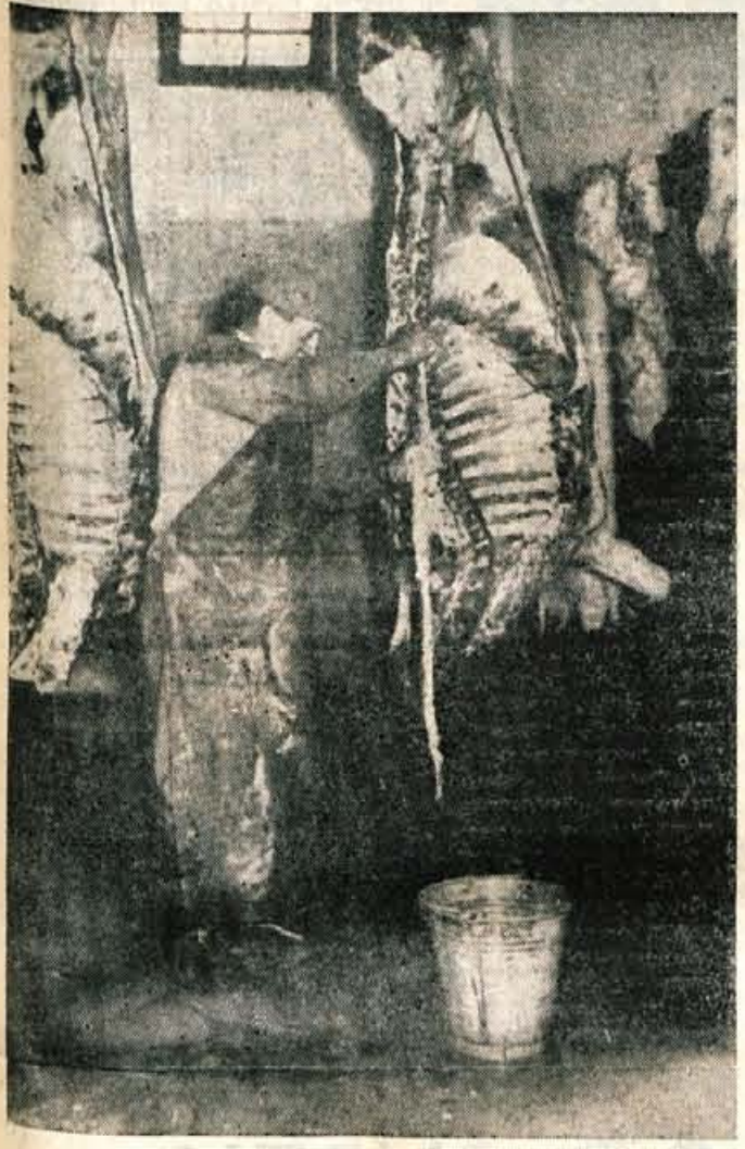
Kar nam ni bilo všeč v klavnici Lesce

Morda pa ne bi bilo prav, da se prelevimo v pikolovce. — »Zakaj pa ne pogledate lepih lokalov, čistih blestečih pultov, kulturno urejenih prodajaln?« nam bi očitali prizadeti. Res, dosti je tega. Toda če je že govora o turizmu, o izboljšanju naše preskrbe, o kulturnem poslovanju, o preventivni zdravstveni službi, o skrbi za zdravje delovnega človeka, potem tudi podobnih pomanjkljivosti ne smemo zakrivati. Zlasti pa ne v tistih primerih, kjer le-te niso odvisne od investicij, vsaj ne velikih, in se da že z dobro voljo, večjo čistočo in načinom dela odpraviti ali vsaj ublažiti »navadna«, ki bodo v oči in zmanjšujejo naše že dosežene uspehe na tem področju. K. M.