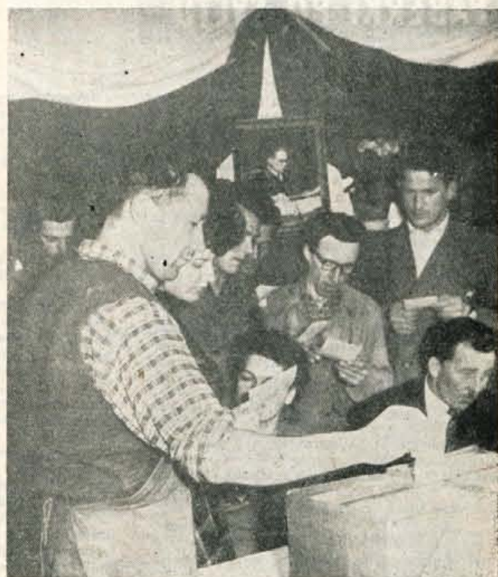
Ze sredi marca so se v delovnih kolektivih začele volitve novih delavskih svetov. V industrijski skupini našega okraja bo blizu 27.000 volivcev izvolilo 59 delavskih svetov. Prav toliko teh organov delavskega upravljanja z 1432 člani pa v tem času polaga račune o dosedanjem delu.

Na sliki: volitve v podjetju »Roleta« v Kranju.