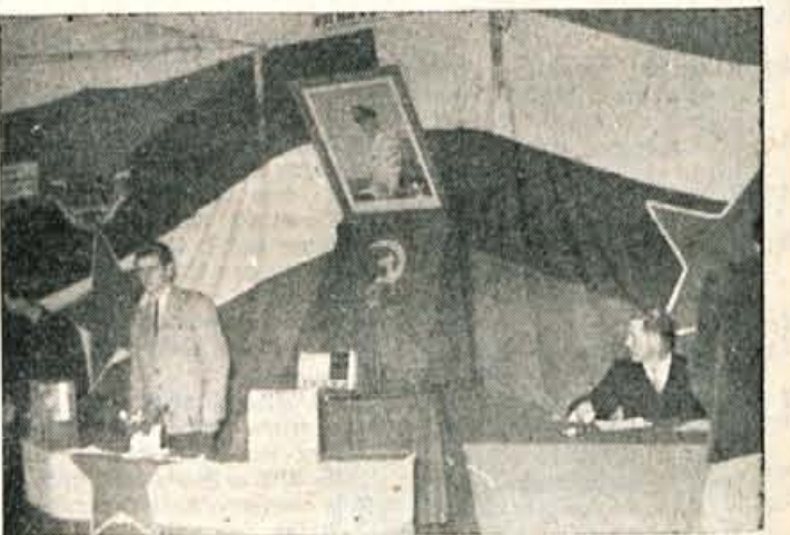
V tem trenutku je bilo volišče na Hrušici prazno. Vendar so bili člani komisije zadovoljni, saj so že v zgodnjih jutranjih urah zabeležili zelo lepo volilno udeležbo

glavnem trgu v Železnikih je zvočnik oddajal pesni in potek volitev. Ljudje so se ustavljali, poslušali in še urneje ubrali pot pod noge naprej, na volišče, potem pa domov in po opravkih. Na volišču v Davčah je ob 7. uri zjutraj čakal 84-letni kmet, ki je še v temi odšel z doma, da bi čimprej oddal svoj glas za boljšo bodočnost, za nadaljnjo, že začeto pot k napredku kmetijstva. Od 22 volišč v občini jih 14 ni imelo telefonske zveze in je v glavnem mladina vzdrževala zvezo.