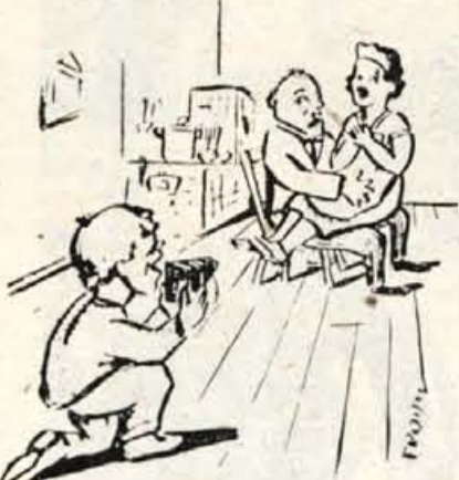
— Očka, hodita z Misko malo pri miru. Mamica mi je za vsako sliko obljubila sto dinarjev.