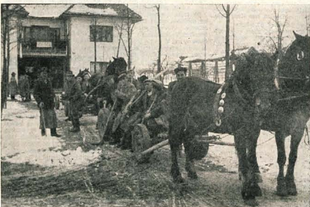
Kokriški gasilci so se potem, ko so volili, odpravili na prostovoljno delo. Šli so pripravljati les za novi gasilski dom na Kokričih. Mudilo se jim je, kajti radi bi, da bi bil dom čimprej dograjen

V občini Ziri je do 12. ure oddalo svoje glasove že 80 odstotkov volivcev, na 10. volišču celo 91%. Na volišču št. 1 v Brekovičih je ob 7. uri zjutraj kot prvi glasoval 82-letni Matevž Petračič. Volivci so prihajali skozi visoke snežne zamete z Žirovskega vrha, Račeva in drugih krajev, da bi zadostili svoji težnji in glasovali za našo ureditev, za boljšo bodočnost. V nekaterih osamljenih naseljih so uredili prevoze, da bi pomagali starčkom ali bolnikom na volišča skozi hude zamete in po poledenelih potih.