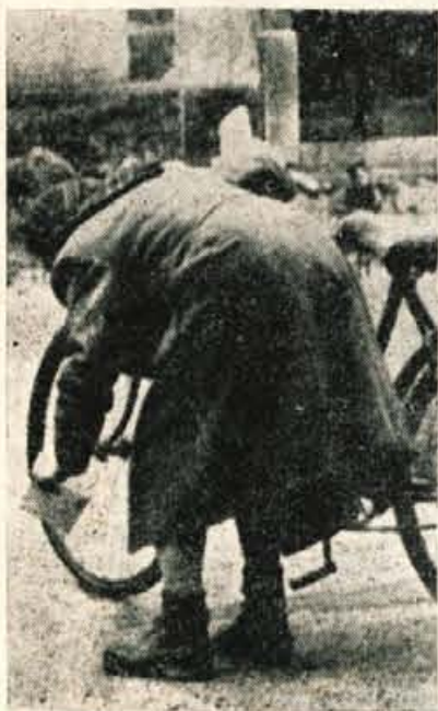
— Nihče me ni videl...

hranke 150 dinarjev. Naslovljenec pisma pa je bil prav blizu — Pokojniški zavod. Toda niti pisma niti denarji ni bilo več iz velikega cekarja najditeljice.