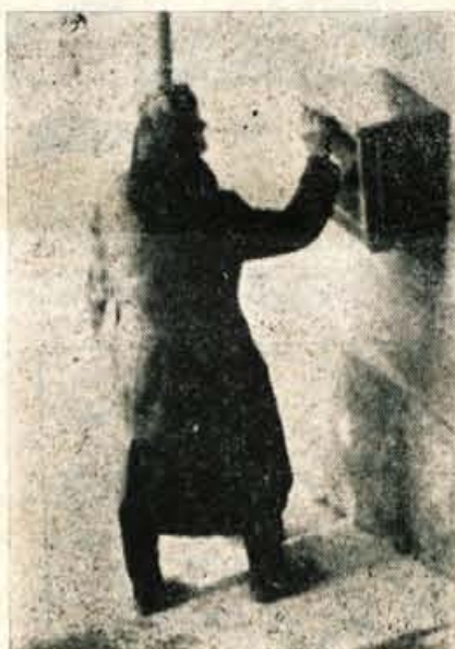
Pismo je vrgla v nabiralnik

Naslednje odprto pismo, prav tako s 150 dinarji in znamko, je pobrala priletna žena na Savskem bregu. Morda