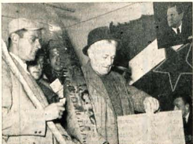
Preden so odšli na delo, so kokriški gasilci izpolnili še svojo državljansko dolžnost na volišču