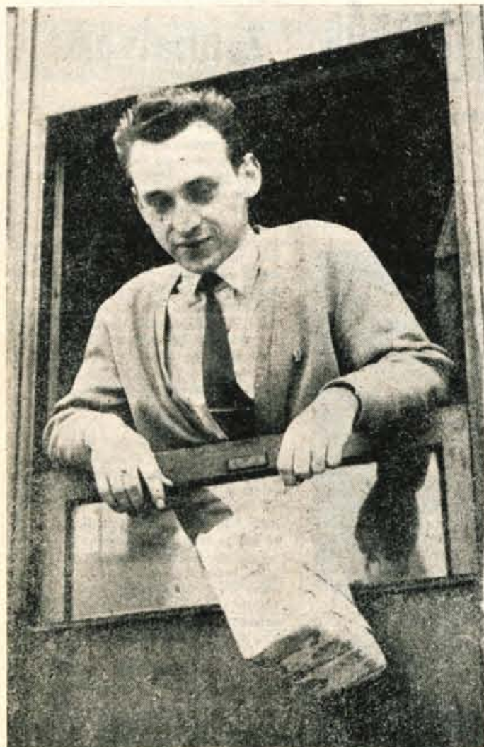
Čevlje ste pozabili!

Pol njih je odbilo na gimnazijski uri. Dijaki in šolarji so se vsuli po cestah. Po blatni Golniški cesti v Kranju, mimo fizikalnega stadiona, so šle tri dijakinje.