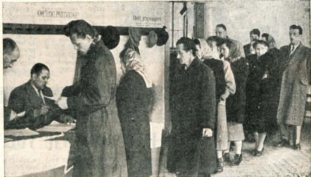
Na volišču v osemletki na Jesenicah je bilo takole živahno...

to, da včasih nisem imela te pravice, ker sem pač ženska. Potem je počasi odšla skozi vrata.