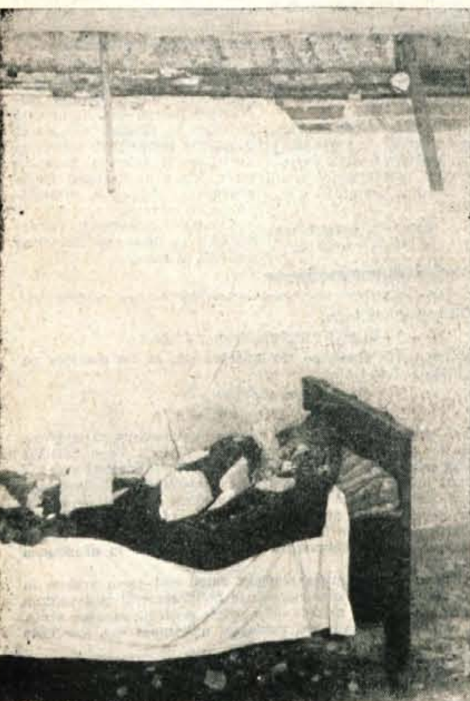
Kako bi bilo s človekom, ki bi ga potres presenetil v postelji?

Vesti, ki so se razširile po potresu, niso bile napihnjene. Vse kaže, da je potresni sunek, ki je v sredo popoldne vznemiril prebivalce Gorenjske, najbolj prizadejal zaselek Zablje pod Storžičem, ki ima le štiri domačije.