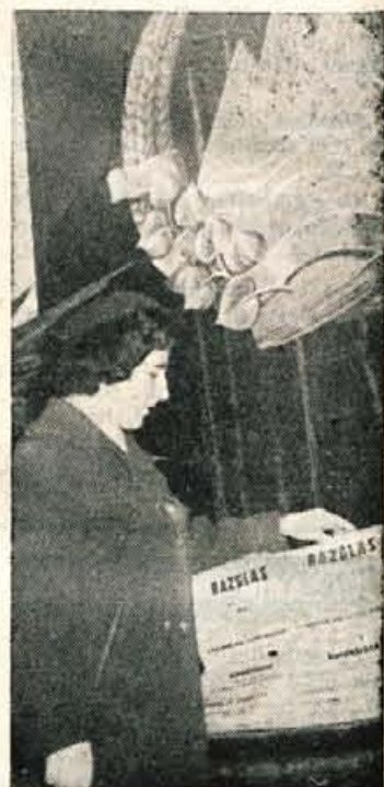
Je kaj tremo? Nič, čeprav je prvič spustila svoj »glas« v skrinjico

v tem tekmovanju res izkazala! Hkrati so bile volitve za mladino v Godešiču povod za sproščeno manifestacijo. Krnalu potem, ko so tam odprli volišče, je prikor-