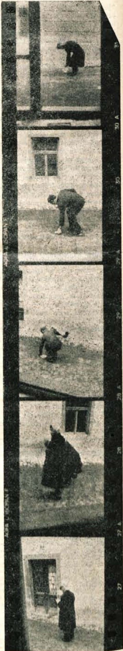
Na slikah od zgoraj navzdol: Dekle z rdečo baretko v Tavčarjevi ulici — Bilo je za pol litra — Da bi vsaj izpit v svojem poklicu položil z boljšo oceno — Mož in žena sta našla pismo in ga oddala (zadnji sliki)

Zelo brezbrizen je bil starejši gospod z ženo na kranjski postaji. Ko je „raztreseni“ sopotnik oblekel plašč, vzel baretko in rokavice ter izstopil, je poleg njiju ostal zavitek s čevlji. Pogledala sta ga in se pogovarjala dalje, ne da bi se več zmenila za pozabljeni zavoj. Niti sopotnika nista poklicala niti spovednika, da bi mu izročila pozabljeni predmet. Na poznejše vprašanje, čigav je zavitek s čevlji, je on malomarno odgovoril: „Nekdo, ki je izstopil, ga je pozabil.“