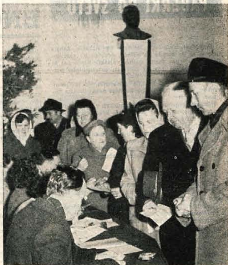
Ze v jutranjih urah so bila včeraj volišča polna. Tako je bilo tudi na volišču osemletke »France Percešeren« v Kranju