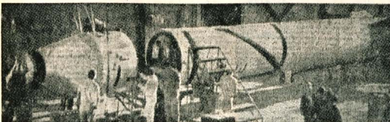
Naša slika kaže ameriško raketo Jupiter, ki je ponela v vesolje prvi ameriški umetni satelit. Zaključna dela pred izstrelitvijo v vesolje

v ZDA laže biti ženska kot moški, zakaj sodobni Američan dobi tako rekoč iz leta v leto nove dolžnosti. V domači hiši je mož najpogosteje edina finančna opora družine. Kot poslovni človek mora Američan vložiti vse svoje sile, da ne zaostane za naglim razvojem in tempom življenja. Marsikateri moški izgublja zaradi velikih dolžnosti zaupanje v lastno moč in sposobnost, prav to pa navajajo sodno medicinski strokovnjaki kot razlog, da je med samomorilci trikrat več moških kot žensk.