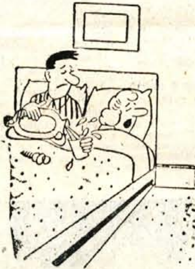
»No, mi boš že prinesel tisti kozarec vode!«

zajeli samo severnega dela ZDA, temveč tudi južne države ob atlantski obali. V državah New York in Pennsylvanija je zapadlo nad meter snega, po ulicah Philadelphije pa so bili tudi do 4 metre visoki zameti. V zalivu Atlantic Cityju so opazili devet metrov visoko ledeno goro. To je edinstven pojav, ki ga ljudje še ne pomnijo.