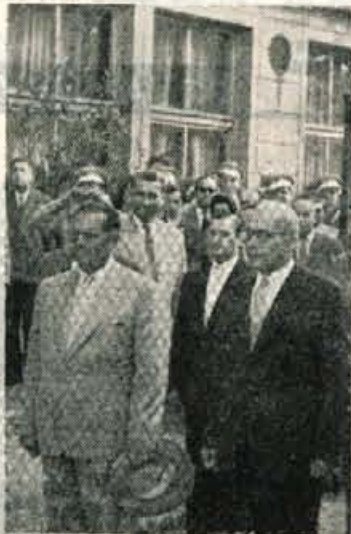
Vladislav Gomulka in predsednik Tito v Ljubljani