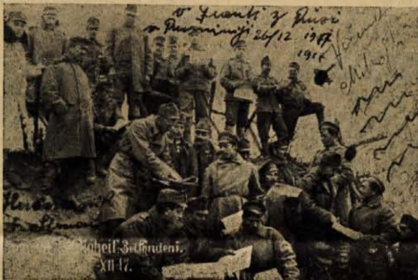
Ruski vojaki so brali svoje časopise

26. decembra pa so predlagali, naj se skupaj fotografiramo, češ da odhajajo s fronte domov, kjer se bodo borili proti kontrarevolucionarnim tolpam. Se taisti dan smo si z njimi pri arčno segli v roke.«