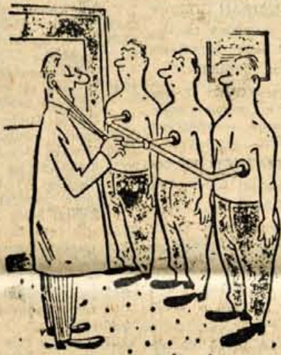
»Ne zamerite, gospodje, toda praksa se mi je potrojila.«