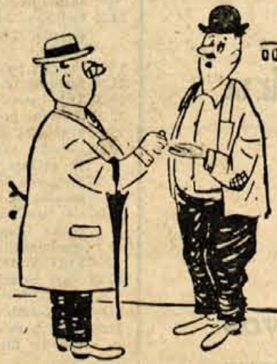
»Zakaj pa ne delate?« »Mar naj še z delom podpiram nepridiprava, kakršen sem?«

zije. Cenijo, da pritisk vsebuje nad polovico celotne sile atomske bombe. Zračni pritisk se ustvari na površini ognjene kroglice, se nato od nje loči in v obliki ogromnega zgoščenega mehurja šini na vse strani. Od središča eksplozije se z velikansko hitrostjo premika zgoščeni zrak, ki ima izredno rušilno silo. Rušilni valovi se usmerijo v dve nasprotni smeri, kar povzroča nekak viharjen veter, ki na določenem področju zruši in uniči vse pred seboj.