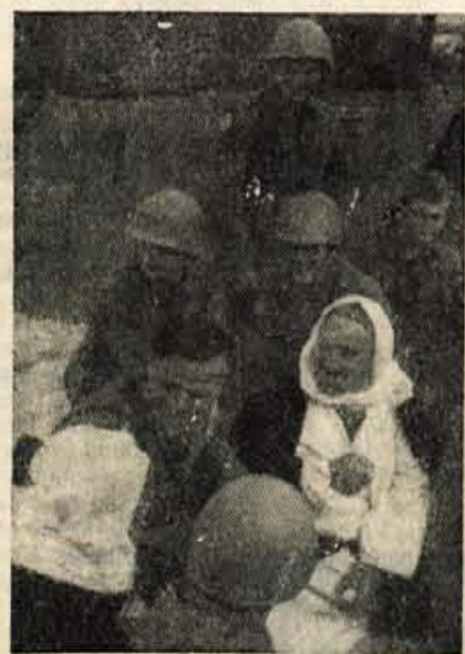
ZGORAJ: POLITICNA URA V PUSCAVI. — SPODAJ: V POGOVORU

ENOTE JUGOSLOVANSKE LJUDSKE ARMADE, KI SO V EGIPTU V OKVIRU VARNOSTNIH SIL ORGANIZACIJE ZDRUŽENIH NARODOV, SO DOBILE ENO NAJTEŽAVNEJSIH NALOG: ZASESTI SINAJSKI POLOTOK ZA UMIKAJOCIMI SE IZRAELCI. NAŠI SO TO NALOGO OPRAVILI V SPLOŠNO ZADOVOLJSTVO. ZLASTI TOPLO SO JIH POVOD POZDRAVLJALI DOMAČINI - EGIPČANI.