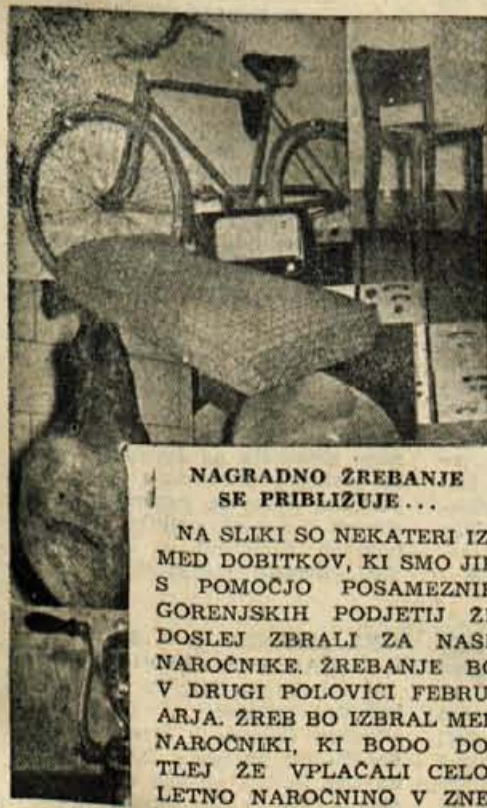
NAGRADNO ŽREBANJE SE PRIBLIŽUJE...

NA SLIKI SO NEKATERI IZMED DOBITKOV, KI SMO JIH S POMOČJO POSAMEZNIH GORENJSKIH PODJETIJ ZE DOSLEJ ZBRALI ZA NASE NAROČNIKE. ŽREBANJE BO V DRUGI POLOVICI FEBRUARJA. ŽREB BO IZBRAL MED NAROČNIKI, KI BODO DOULEJ ZE VPLAČALI CELOLETNO NAROČNINO V ZNESKU 600 DIN.