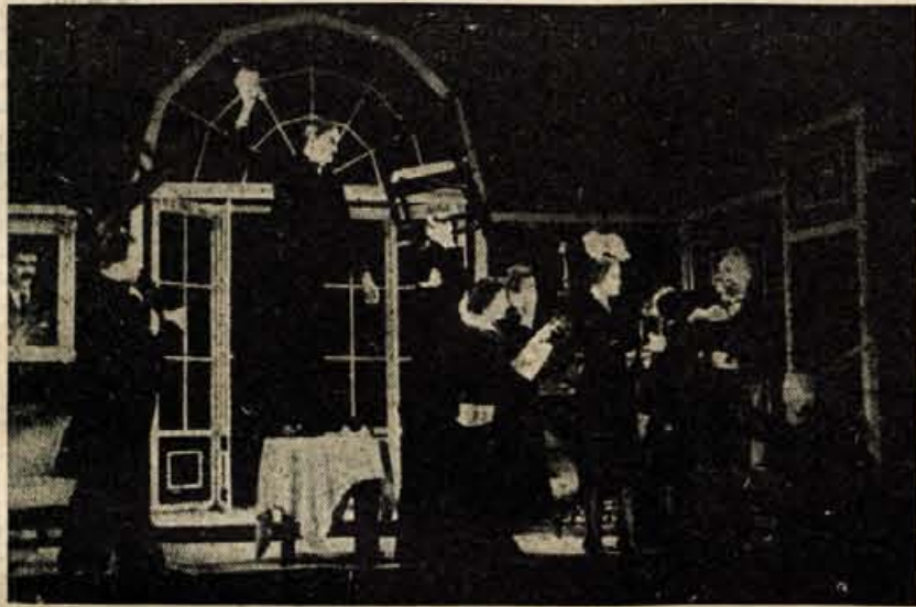
Nušičevi »Zalujoči ostali« na odru MG - Jesenice