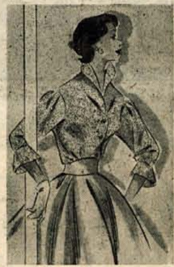
ZA PLES Bluza iz organdija ali nilona, kakršno si lahko omislijo zlasti mlada dekleta.