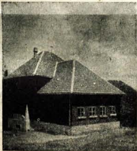
Osnovna šola Martinj vrh

ljem vsako jesen resne skrbi. Na Gorenjskem menda najhujše občutijo pomanjkanje šolskih prostorov v Kranju in na Jesenicah. Otroci obiskujejo v teh dveh mestih pouk