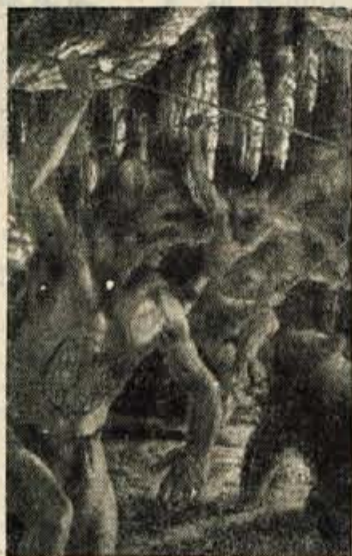
Obredni ples. Možje, oblečeni v medvedje kože, s prikazovanjem prizorov z lova, prosijo bogove za uspeh pri lovu.

„Mislim, da bi lahko sprejela,“ je rekel po kratkem premisleku.