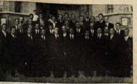
Pevski zbor »Enakost«

Obrotniški pevski zbor »Enakost« v Kranju že sedem let vztrajno in uspešno goji našo narodno, umetno in borbena pesem. V teh letih je imel zbor 23 samostojnih koncertov doma, 4 gostovanje na Dolenjskem, eno na Stajerskem in eno v Crikveni.