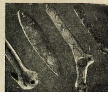
Zgoraj kamenita ženska glava, najdena v Franciji, spodaj razno orodje iz kamna in kosti.