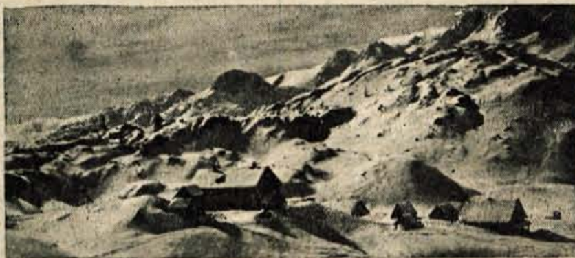
SMUČARSKI RAJ Koča pod Bogatinom pri Komni

Naši turistični delavci na splošno niso neizkušeni. Tudi po svetu so si ogledali, kako je treba voditi turistično poli-