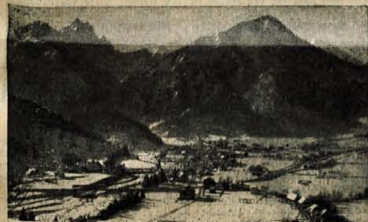
KRANJSKA GORA Eno naših turističnih središč

Sem sodijo v prvi vrsti prometne zveze. Včasih so na Gorenjsko vozili pozimi tako imenovani »smučarski vlaki«. Z njimi so pričarjali turisti od vsepovsod.