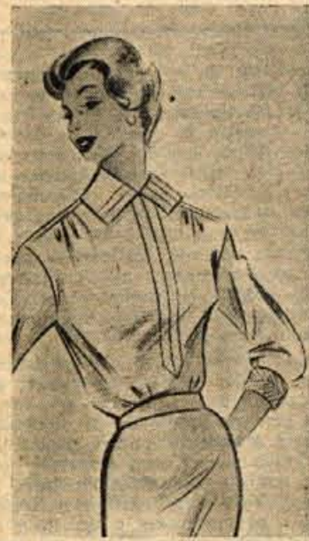
Ortasta bluz s kričetrinskimi rokavi za službo in dom

Ledvice izgube duh po seču, če jim izrežemo sečevode in jih namakamo nekaj časa v vodi ali mleku. Priporočljivo je, že narezane ledvice nekoliko prepražiti v kozici brez masti, da tekočina, ki je v njih, delno izhlapi.