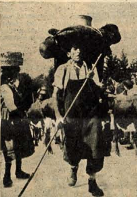
Planšar s planine baše, ker tam ni več za krave paše