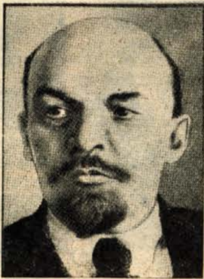
Duša Oktobrske revolucije VLADIMIR ILJIČ LENIN

Na komandi mesta je bila tudi menza, kjer so se vsak dan hranili novi mobiliziranci, ki so prihajali peš iz sto in več kilometrov oddaljenih krajev, nato pa so se odpeljali z vlaki naprej. Med mobiliziranci smo začeli s propagando, jih nogo- varjali naj gredo domov, češ da je vojne konec in tako dalje. Naša prizadevanja so bila uspešna. Pogosto so vlaki odpeljali naprej prazni, ker so