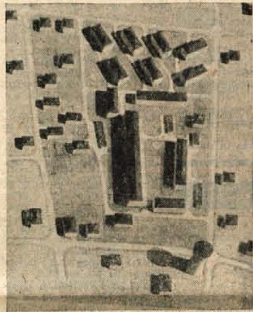
Maketa II. osnutka z velikim blokom sredi naselja. Gradnja bi veljala 25 milijonov več, kot gradnja naselja po I. osnutku.

OPOMBA UREDNIŠTVA: S pričujočim člankom želj začeti uredništvo našega lista temeljito razpravo o problemih stanovanjske in komunalne gradnje v Kranju. Uredništvo želi, da bi se k tej razpravi priglasili tudi drugi z željo, da bi bilo reševanje stanovanjske in komunalne problematike mesta Kranja kar najbolj smotrno in gospodarno.