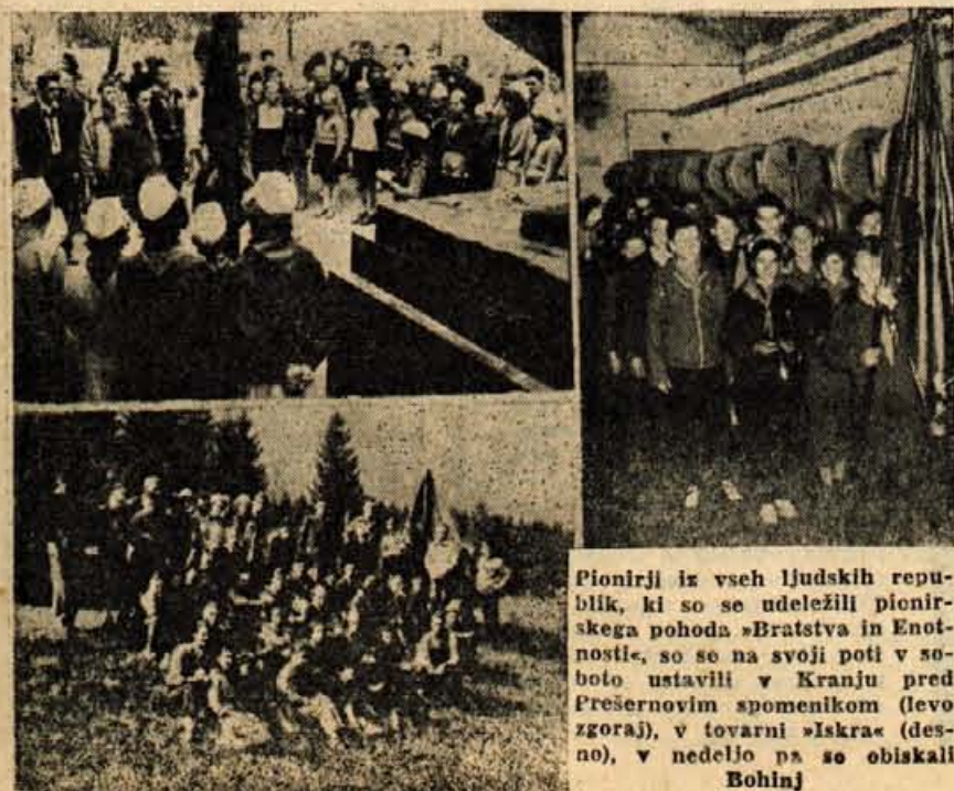
Pionirji iz vseh ljudskih republik, ki so se udeležili pionirskega pohoda »Bratstva in Enotnosti«, so se na svoji poti v soboto ustavili v Kranju pred Prešernovim spomenikom (levo zgoraj), v tovarni »Iskra« (desno), v nedeljo pa so obiskali Bohinj

Občinski ljudski odbor Bled je že imel svoje zbor volivcev, na katerih so vaščani izbrali 67 kandidatov za nove odbornike. Od teh bodo izvolili 28 odbornikov ali 42% vseh kandidatov. Volivci so med kandidate določili 28 delavcev, 17 uslužbencev, 19 kmetov, ostala trojica pa so različnih poklicev. 11 kandidatov je iz vrst mladine. jb