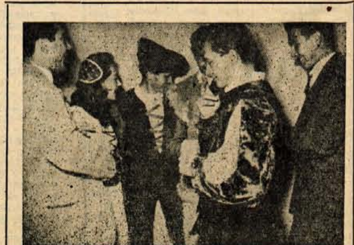
Novost, ki jo je uvedlo Prešernovo gledališče v Kranju v minuli sezoni so bile javne generalke, katerih glavni namen je bil: ustvariti neposreden stik igralcev z občinstvom. (Slika) — Z letošnje javne generalke »Romeo in Julija«. Igralci Julija, Baltazar in Romeo v razgovoru z občinstvom v gledališki avli