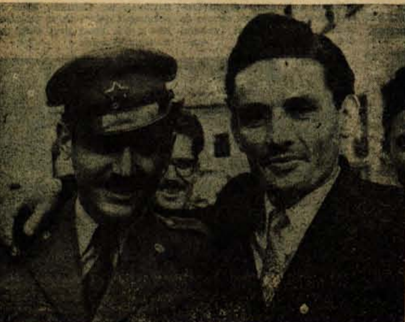
DOBITNIKA AVTOMOBILOV FIAT - 600

»Ali jaz?« je užaljeno vprašal Miklavž. »Jaz nikoli! Še danes ga ne prenesem. Kadar se ga napijem, sem bolan. Ne poznaš še pravih pijancev, takih, ki ne morejo živeti brez pi-jače.«