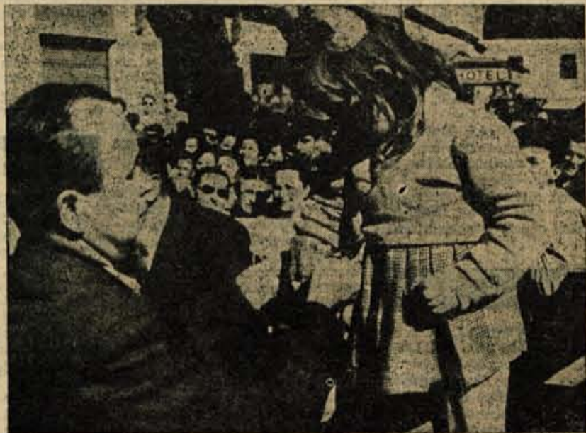
ŠTEVILKE JE VLEKLA MALA SPELCA

Ob 14.35 smo čuli po zvočnikih prvi razglas, ki je iskal izgubljenega otroka. Obenem je napovedovalec raz-