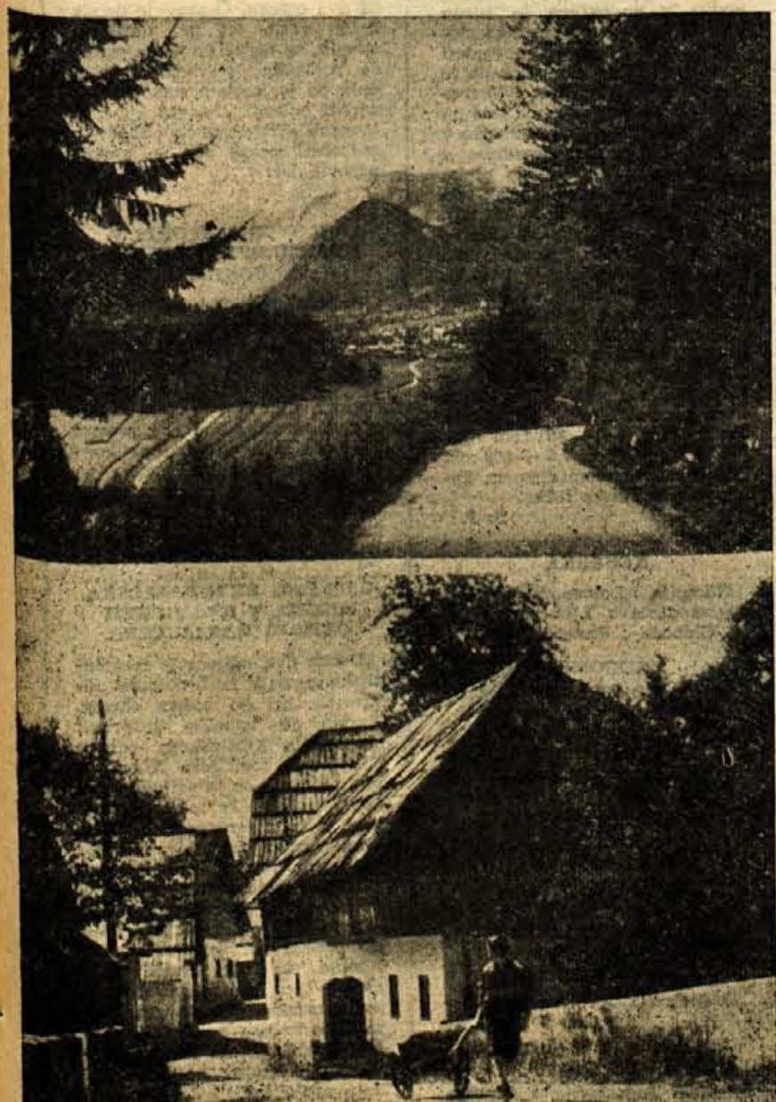
JESEN V BOHINJSKEM KOTU

V pripravah na volitve zborov proizvajalcev zlasti izdatno sodelujejo sindikalne organizacije. Priprave večidel ugodno potekajo, le predvolilni akciji v manjših gospodarskih organizacijah (nekateri obratne delavnice, v gostinstvu itd.) kaže bolj pomagati, ker so te delavnice raztresene, z maloštevilnimi kolektivi in marsikje brez razgledanejših političnih aktivistov. Volitve v zbornice proizvajalcev je treba v teh, pa tudi v drugih večjih gospodarskih organizacijah še posebno tolačiti, ker so te volitve novost. Pojav, ki mu ne moremo pustiti, da zamaga, je lokalizem tudi v nekaj gospodarskih organizacijah. Kaže se v tem, da hočejo v tem ali onem podjetju spraviti v zbor proizvajalcev človeka, ki naj bi »zastopal« interese svoje gospodarske organizacije. Ko pa razmišljamo, kdo bi bil sposoben najbolje »zastopati«, se seveda ozro najprej po ljudeh iz vrst strokovne inteligence, po vodilnih uslužbencih, direktorjih, po tistih, ki »se na podjetje najbolj razumejo«. Če pa bi izbirali od-