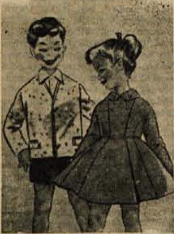
DVA JESENSKA MODELA ZA NAJMLAJŠE