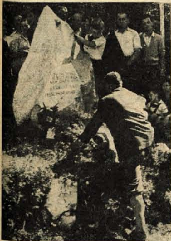
Tudi enajstim pobitim ranjencem na Martinčku so prinesli vence in cvetja

«Se mrtvi so jim bili v napoto. Vrgli so jih v gorečo kočo in 11 borcev je kakor žriveni dar zgorelo za našo prostost.»