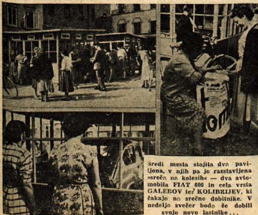
Sredi mesta stojita dva paviljona, v njih pa je razstavljena sreča na kolesih — dva avtomobila FIAT 600 in cela vrsta GALEEOV ter KOLIBRIJEV, ki čakajo na srečno dobitnike. V nedeljo zvečer bodo že dobili svoje nove lastnike...