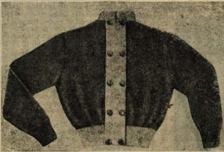
PLETENA JOPICA ZA DEVETLETNO DEKLICO V DVEH BARVAH. NAVODILA ZA PLETENJE SMO OBJAVILI ŽE V PREJŠNJI ŠTEVILKI