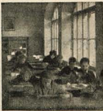
pionirsko knjižnico kot zdaj v študijsko.

Kako rešiti to vprašanje, da bi bilo ugodeno odraslim in otrokom? To vprašanje so znala nekatera druga mesta na pr. Ljubljana, Jesenice, rešiti na zelo učinkovit način. Ustanovila so pionirske knjižnice. Mar v Kranju ne bi bilo mogoče rešiti tega problema na enak način? Nedvomno bi se otroci poslednje mnogo rajši zatekali v svojo —