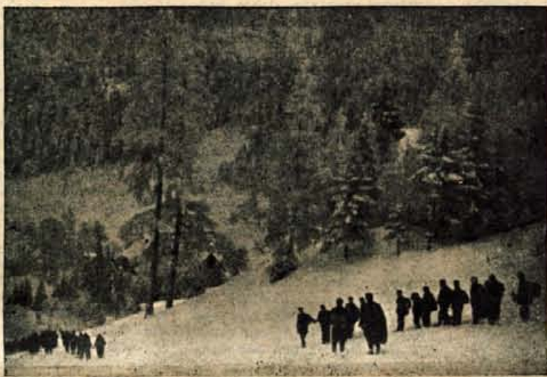
Škofjeloški odred pozimi 1942-45 na poti čez Črni vrh na Primorsko

V spomin na dogodke iz NOB bo v nedeljo, 8. septembra na Jelovici odkrite več spominskih objektov, in sicer na Mošenjski planini ob 10. uri, na Lipniški planini ob 11. uri, na Martinčku ob 12. uri in na Selški planini ob 13. uri.