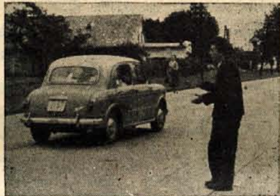
ALI BO KAJ...?