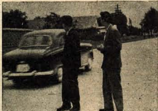
NIČ NE BO...!