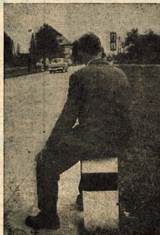
ZALOSTEN POGLED ZA ODHAJAJOČIM...

»Zadnjič sem prav tako ustavil nekemu študentu. Ustavil sem, ker sem pač mislil, da kot študent nima možnosti, da bi potoval drugače. Ko sva se menila, pa mi je rekel, da bi sicer lahko šel v Bohinj z očetom, ker je imel na motorju še prostor, vendar ga je raje pustil, da je šel sam, ker se mu je zdelo, da je potovanje z avtostopom boljše in zabavnejše.«