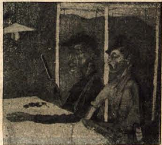
MARJAN DOVJAK: ZELEZNICARJA (olje)