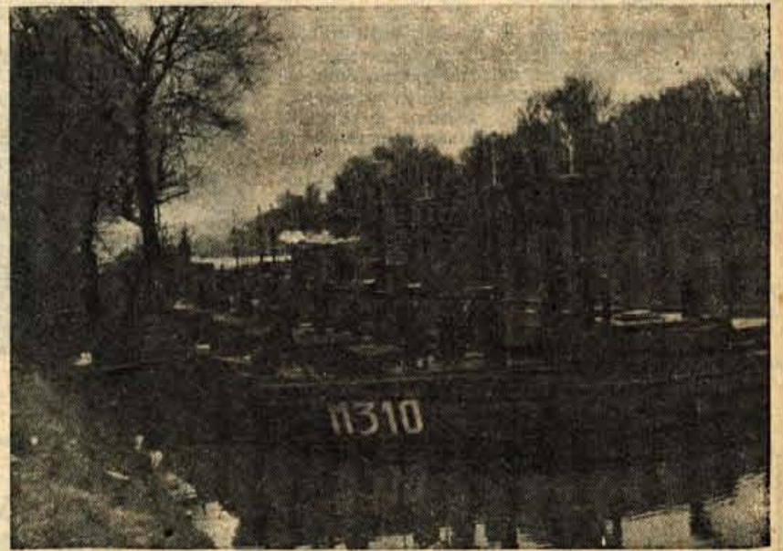
ZIMOVNIK REČNE FLOTILJE JVM