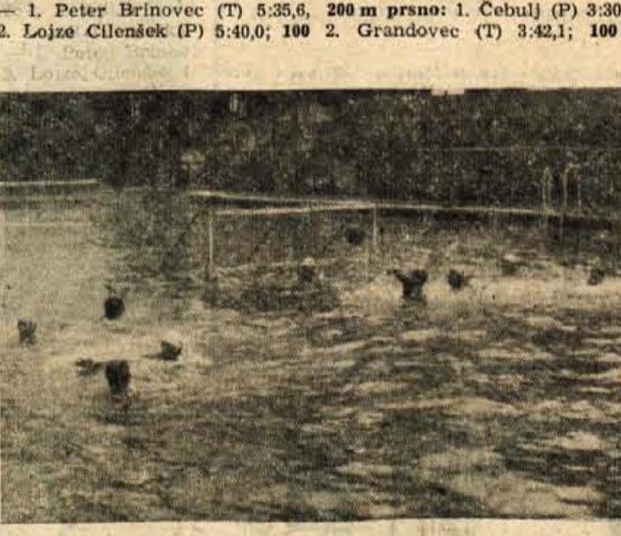
Z republiškega prvenstva: tekma med »Ljubljano« in »Ilirijo«.

SPREJMEMO USLUŽBENCA ZA OGLASNO-KOMERCIALNI ODDELEK. — »GORENJSKI TISK« V KRANJU.