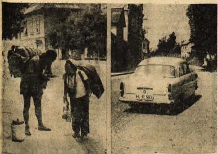
Turistična sezona je v polnem razmahu in skozi naše kraje dan za dnem hitijo številni avtomobili tujecev, namenjenih na Jadransko morje in drugam (zgoraj). Turista posebne vrste pa sta Indija na sliki levo zgoraj, ki potujeta na avtostop; kot sta dejala našemu fotografu, bosta na ta način prepotovala okrog 30.000 kilometrov, na polj pa bosta 8 mesecev. — Primskovski most čez Kokro je te dni zaprt za promet, ker ga bodo obnovili in razširili (levo).