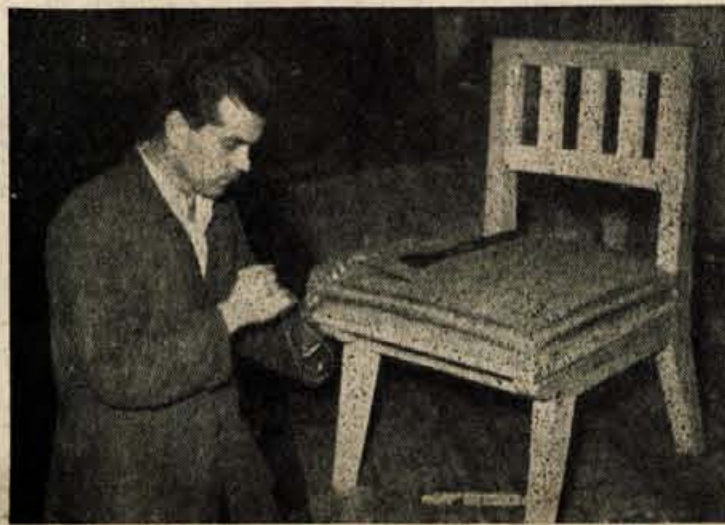
DELO KAŽE DOBRO OPRAVITI, DA BO STRANKA ZADOVOLJNA

Število privatnih obrt. obratov se je tudi v zadnjih dveh letih nekoliko zmanjševalo, število obratov v družbenem sektorju pa delno povečalo. Nekatera že obstoječa podjetja so