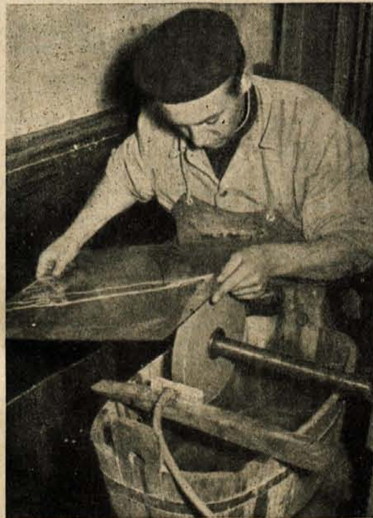
STEKLO JE TREBA VSTAVITI

O nedograjnem Sindikalnem domu v Kranju smo pisali v novoletni številki pod rubriko Aktualno vprašanje. V ponedeljek, 14. t. m., so se v Kranju sestali zastopniki občinskega in okrajnega sindikalnega sveta ter drugih organizacij in forumov, da bi se dokončno pomenili o tej gradnji. Ob tej priložnosti je bil osnovan gradbeni odbor, finančna, propagandna in gradbena komisija. Stroški za dokončanje vseh del bodo znašali predvidoma okoli 80 milijonov dinarjev. Udeleženci so na tej seji pretresli vse možnosti za dotok denarnih sredstev, ki naj bi jih prispevala vsa Gorenjska. Obstoji predlog, po katerem naj bi kolektivni prispevali povprečno po 500 din na zaposlenega, bodisi iz skladov za samostojno razpolaganje, bodisi od nedeljskega prostovoljnega dela, prostovoljnih prispevkov itd., o čemer naj bi v podjetjih sami odločili. To bi vrglo kakih 20 milijonov dinarjev, razen tega pa bi skušali zbrati nekaj sredstev — po predlogu — iz takih na alkoholne pijače. Občinski in Okrajni ljudski odbor bi prispevala okrog 10 milijonov dinarjev. — Gradnjo sindikalnega doma naj bi začeli nadaljevati letos meseca aprila.