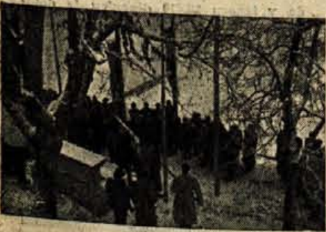
Ustavili so se tudi pred spomenikom talcev, ki so padli pred petnajstimi leti v herojski bitki ob napadu okupatorja na Dražgoše.

SO SE V DRAŽGOŠAH SPET SREČALI BORCI CANKARJEVEGA BATALJONA