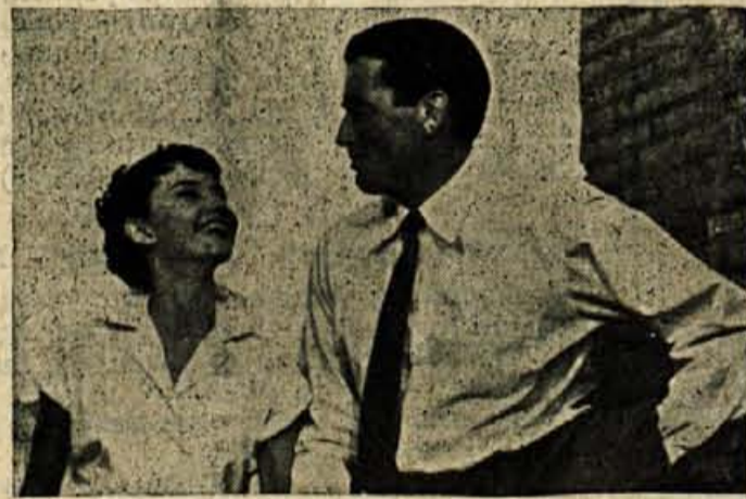
NAJPOMEMBNEJSI? Gregory Peck

pa se za otroka ni več brigala. Izročila ju je v varstvo svojih novi tašči, materi svojega novega moža pevca Dicka Haymessa, ta pa svoji sosedki, »Društvo za preprečevanje krutosti proti otrokom« je Rito tožilo, toda slavna zvezda se je izmazala. Kot kos prtljaje romajo otro-