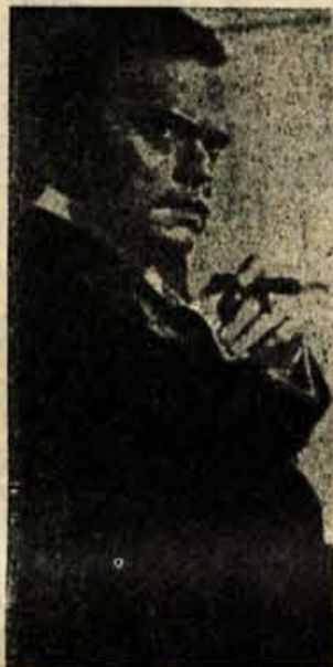
ZAKAJ TAKO MRKO? Orson Welles

Gregory Peck, ki mu je letos 40 let, se je lani 19 ur po ločitvi s prejšno ženo, s katero ima tri sinove, poročil s 24-letno Parižanko Veroniko Passani, ki je po materi Rusinja, po očetu Francozinja, po poklicu pa novinarka. Elegantna Veronika zatrjuje, da bo obdržala Gregoryjevo ljubezen, ker mu bo znala venomer dopovedovati, da je najpomembnejši moški na svetu. Zdaj se baje še trudi, da bi se priljubila njegovim trem otrokom. Otroci pa so vendarle nekaj velikega izgubili in kdo ve, če ne bodo postali kot toliko drugih »hollywoodskih sirot«, ki jih kot nadležen tovor vlačijo iz zakona v zakon, dokler se končno ne najde zanje kaka stara mama ali dobrosrčna soseda.