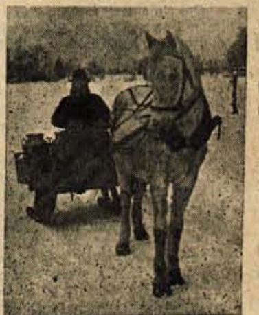
Kristanov »ata« je res prava gorenjska grča...

dim cigarete nama je vzbujal občutek tako potrebne toplote.