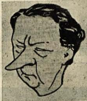
Vodja britanskih laburistov Gaitskell zahteva razpis splošnih volitev, ker pravi, da ni dovolj zamenjati samo predsednika vlade.

drugega izhoda, ker Butler ne uživa zadostne podpore v lastnih vrstah, medtem ko ima Macmillan za seboj dobro organizirano desnico v vladajoči konservativni stranki. Kocka je torej padla na Macmillana zgolj zato, ker bo lahko združil vrste svoje stranke v tako usodnih trenutkih.