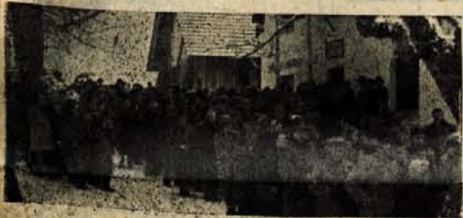
Gorenjci so se ljub slabemu vremenu udeležili sprevoda na grobove dražgoških žrtev.

GLASILO SOCIALISTIČNE ZVEZE DELOVNIH LJUDI ZA GORENJSKO