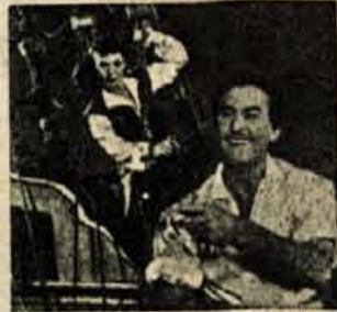
„LOMILEC SRC“ Errol Flynn

ci slavni staršev iz zakona v zakon. Hčerka Lane Turner, očarljiva Chery Christine, se res ne more tako hitro navezati na nove očete, kakor hitro Lana Turner menjava može, zato nje-