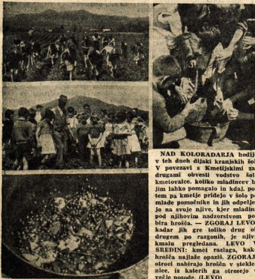
NAD KOLORADARJA hodijo v teh dneh dijaki kranjskih šol. V povezavi s kmetijskimi drugami obvesti vodstvo šole kmetovalce, koliko mladincev bi jim lahko pomagalo in kdaš, potem pa kmetje pridejo v šolo po mlade pomočnike in jih odpeljejo na svoje njive, kjer mladina pod njihovim nadzorstvom pobira hrošča. — ZGORAJ LEVO: kadar jih gre toliko drug ob drugem po razgonih, je njiva kmalu pregledana. LEVO V SREDINI: kmeti razlaga, kako hrošča najlaže opaziš. ZGORAJ: otroci nabirajo hrošča v steklene, iz katerih ga stresejo v večje posode. (LEVO)