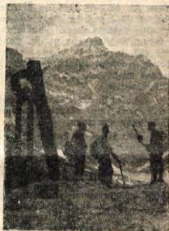
Letošnja mladinska štafeta pri spomeniku padlim pod Triglavom

V Skofji Loki so počastili Dan mladosti v petek s svečano akademijo, ki so jo pripravili dijaki gimnazije, učenci osnovne šole in člani KUD »Tone Siferer«. Za uvodnim govorom dijaka Lačkoviča je bil pester spored recitacij, glasbenih in plesnih točk. V soboto zvečer je mladina zakurila po vseh bližnjih vrhovih kresove.