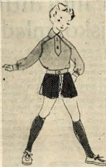
SPORTNO ZA FANTE