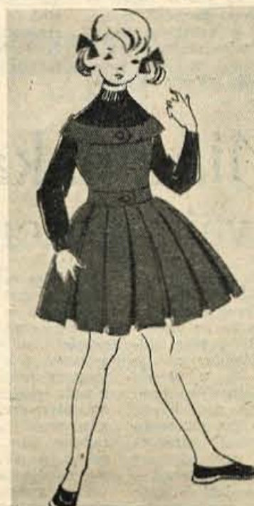
LJUBKA DEKLISKA OBLEKA ZIVAHNE BARVE, V TOPLIH DNEH ZAMENJAMO PULOVER Z BLUZO