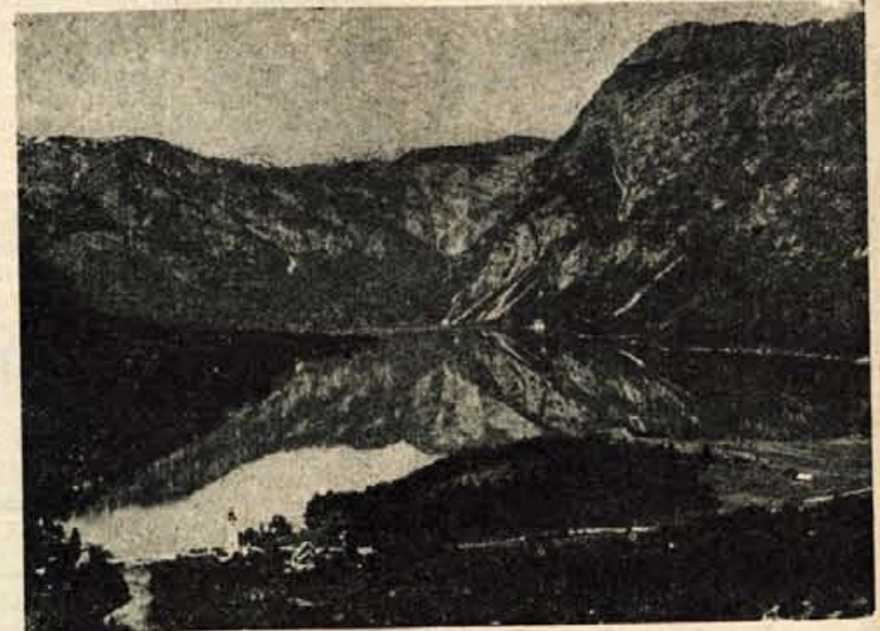
NEIZKORISČENE MOZNOSTI V bohinjskem kotu je bil turizem pred vojno relativno bolj razvit, kot je zdaj. Res, zdaj pa kot da ne moremo na zeleno vejo...