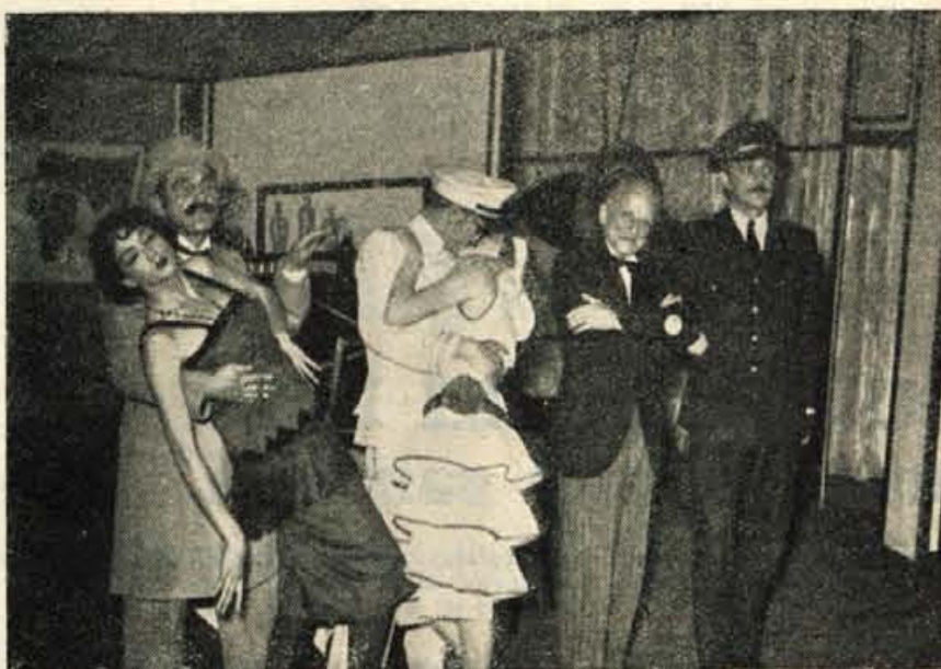
Zaključni prizor Leščanove komedije SLEPI POTNIK, ki jo uprizarja Prešernovo gledališče v Kranju