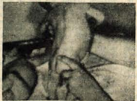
Po operaciji sta dečka hitro ozdravela brez kakršnihkoli komplikacij in motenj.