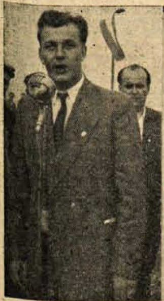
Z MEDNARODNIH MOTO DIRK V SPEEDWAY VOZNI

Lojalni publikli se je zahvalili za pozornost vodja poljske ekipe (levo zgoraj). — Drznost in junaštvo - po ključni odlički vozačev (desno zgoraj). — Zlat, srebrn in zelen lorvorjev venec za zmagovalce. Brez dvoma so jih zaslužili! (desno spodaj)