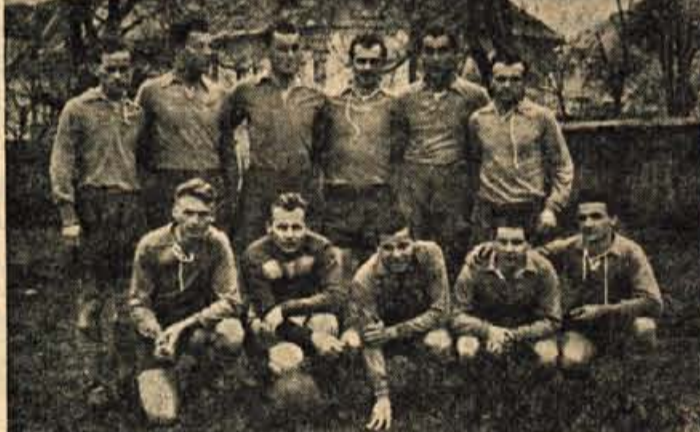
MOSTVO NK »TRŽIČ«, KI SE V LJUBLJANSKO-PRIMORSKI LIGI KAR DOBRO DRŽI

Gimnazijca telovadnica, ki je edina v Kamniku, je postala neuporabna in je zdaj zaprta. Komisija gradbenih strokovnjakov si je ogledala strop nad telovadnico in soglasno ugotovila, da je treba telovadbo prepovedati. Strop se je namreč sesedel za 15 cm zaradi napake v gradnji ali pa prevelike obtežbe. Treba bo zgraditi nov strop vsaj do začetka prihodnjega šolskega leta.