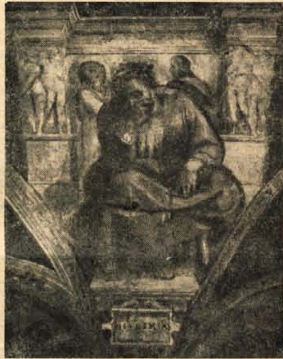
MISCHELANGELO: Zamišljeni Jeremija Detajl iz Sikstinske kapele

Vsa nadaljnja navodila bomo objavili v kulturni rubriki »Glasu Gorenjske«. P. L.