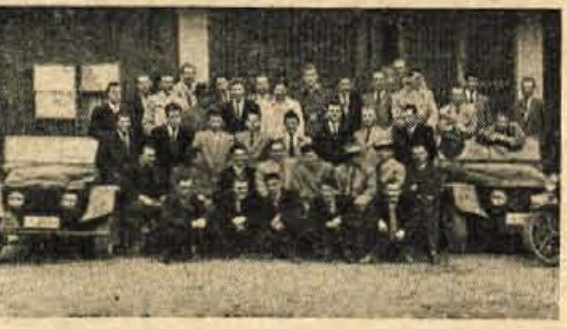
UDELEŽENCI ZADNJEGA TEČAJA

V zadnjih dneh marca je bil zaključen šoferški tečaj Avto-moto društva Kranj, ki je trajal 2 meseca. Do letos so vedno predavali tuji predavatelji, tokrat pa so prvič prevzeli to nalogo člani