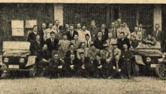
UDELEŽENCI ZADNJEGA TEČAJA

V zadnjih dneh marca je bil zaključen šoferški tečaj Avto-moto društva Kranj, ki je trajal 2 meseca. Do letos so vedno predavali tuji predavatelji, tokrat pa so prvič prevzeli to nalogo člani