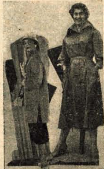
NOVA LINIJA POMLADI Dva modela z revije sodobnega oblačenja na sejmu mode v Ljubljani