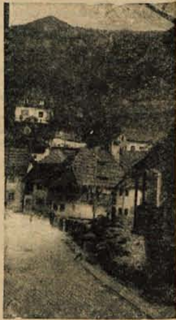
TRZIN — NOVA CESTA NA BISTRICO