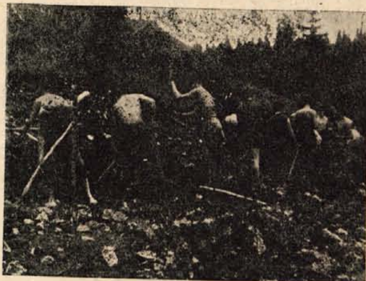
BRIGADA PRI DELU

ZACETEK LJUBLJANSKO-PRIMORSKE NOGOMETNE LIGE