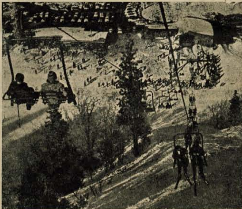
POGLED NA ZAČETNO POSTAJO NOVE VITRANŠKE ŽIČNICE. OB NJEJ PROSTOR ZA PARKIRANJE IN ZASILNE, VENDAR LEPO UREJENE OKREPCEVALNICE