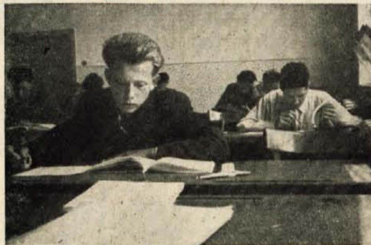
Poklicna svetovalnica v Kranju sodeluje tudi pri sprejemanju kandidatov v industrijske šole. — Slika: Učilnica Industrijske šole v Kranju.

poklicev, ki je na koncu obveznega šolanja, ki prvič nastopa službo, ki se želi izučiti poklica, in defektni mladini, razen tega pa je namen poklicnega usmerjanja tudi pomagati odraslim, to je vsem tistim osebam, ki jim je potrebna pomoč pri izbiri poklica ali pri zamenjavi službe. Pri svetovanju se