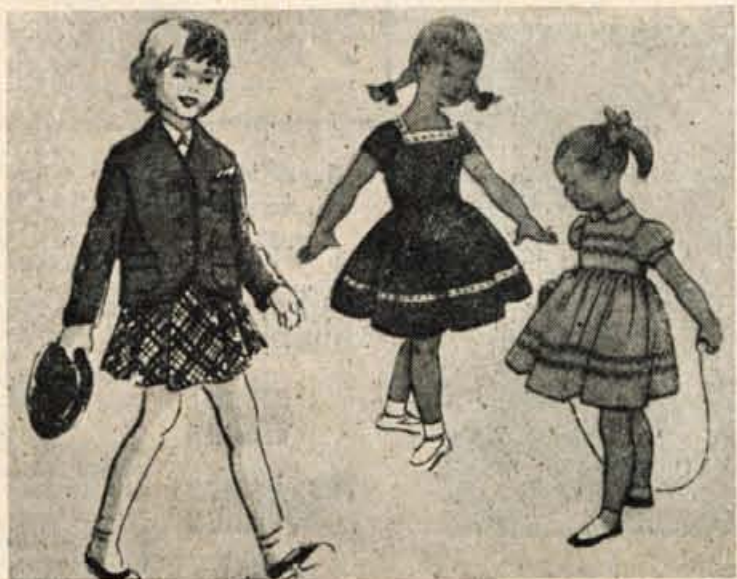
Deklicam bomo izbrale letos pomladansko obleko v rdeči barvi. Na sliki: jopica s športnim krilom in dve obleki za najmlajše.

ceneje. Za delovnega človeka, ki se mu vedno mudi, je veliko prikladnejše, če stopi v trgovino, izbere obleko po meri in plača.