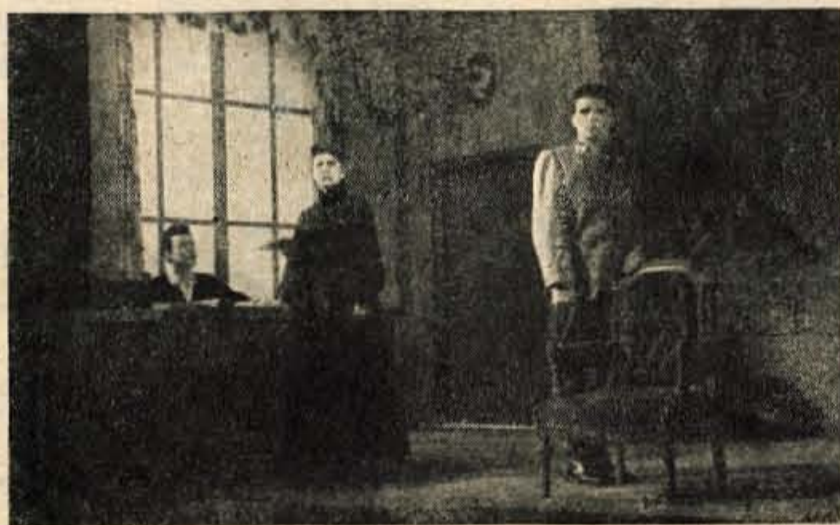
MESTNO GLEDALIŠČE NA JESENICAH JE PRED KRATKIM UPRIZORILO SEDMO PREMIERO V LETOSNJI SEZONI — ČAPKOVO DRAMO »MATI«.