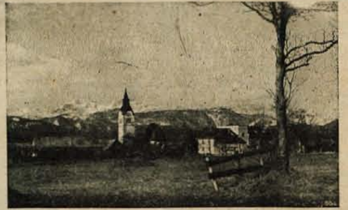
Lesce — industrijski in turistični kraj na Gorenjskem

Anekdota, objavljena v zadnji petkovi številki našega lista pod naslovom »Presnete tujke« velja za dogodek v Sorci, ne v Selcah.