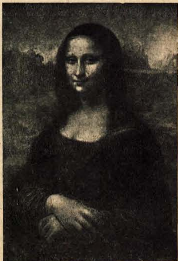
Leonardo da Vinci: Mona Lisa