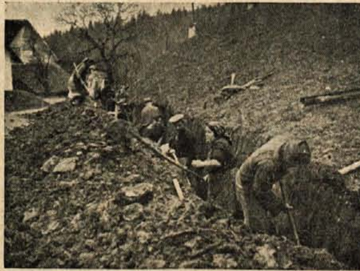
Kot en mož so prišli za krampe in lopate

Leta 1953 smo na Trsteniku zgradili novo šolo. Kako smo z veseljem hodili gledat in občudovat tako moderno šolo. Ponosni smo bili vsi — stari, mladi, posebno pa mi pionirji in ceticbani.