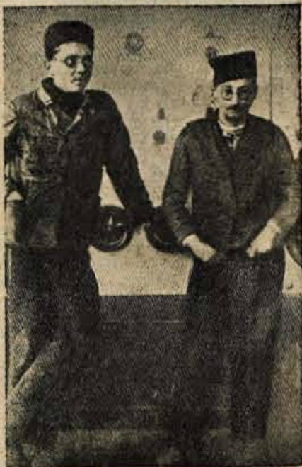
TITO IN MOŠA PIJADE V ELEKTRIČNI CENTRALI JET-NIŠNICE V LEPOGLAVI. TITO JE PRIŠEL V JETNIS-NICO V LEPOGLAVI JANUAR-JA 1929 IZ ZAGREBA. MOŠA PIJADE PA IZ JETNIŠNICE V SREMSKI MITROVICI.

port. Na raportu se je ravnatelj pre-pričal, da učitelj nima prav in hotel je kaznovati samo tistega mladega de-lavca, proti čemur je Pijade protesti-ral in zahteval, naj kaznujejo tudi njega. Seveda so mu ugodili in vrgli so ga v »samico«.