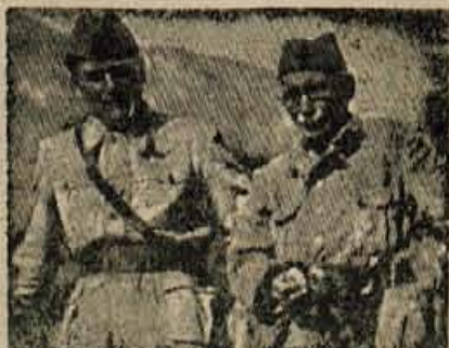
TITO IN MOŠA PIJADA — TOVARIŠA IN SODELAVCA V NARODNOOSVOBODILNI BORBI.