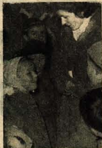
V sredo popoldne je bil Park Svobode v Kranju preurejen v ljubko praviljično vas. Kako tu-

di ne? Ob šestih zvečer so letaki najavljali prvi prihod dedka Mraza. Gruče otrok so se zbirale pred prikupnimi, pisano obarvanimi hišicami že uro prejzgodaj.