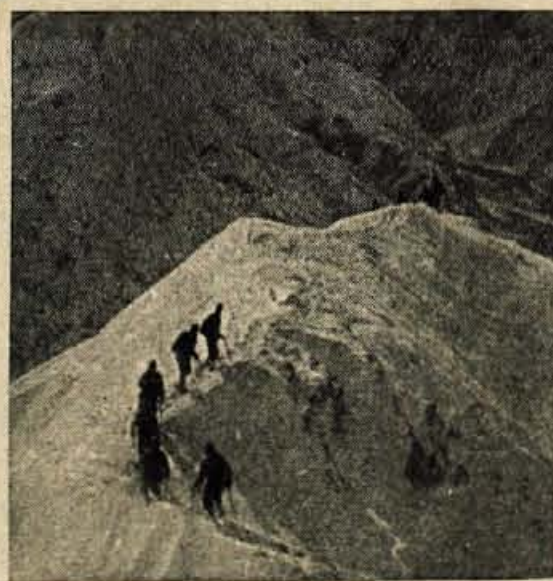
ZIMA V JULIJSKIH ALPAH

So pa ljudje, ki jim tihotapska žilica ne da miru, zato pa jih tudi pripelje v zadrego. Tako se je zgodilo nekemu inozemcu. V njegovi blaznici je carinik našel skrito prejšico, vredno kakih 70 tisočakov, v žimnicji (to je bilo v spalnem vozu) pa dežnike. Očitno se je ta potnik zavedal, da ravna nepošteno, kajti potulil se je v drug vagon. Vendar so carinski organi ugotovili lastnika vtihotapjenega blaga, še preden je vlak pripeljal do Kranja. Morda je ta grešnik v stiski le sklenil: nikdar več!