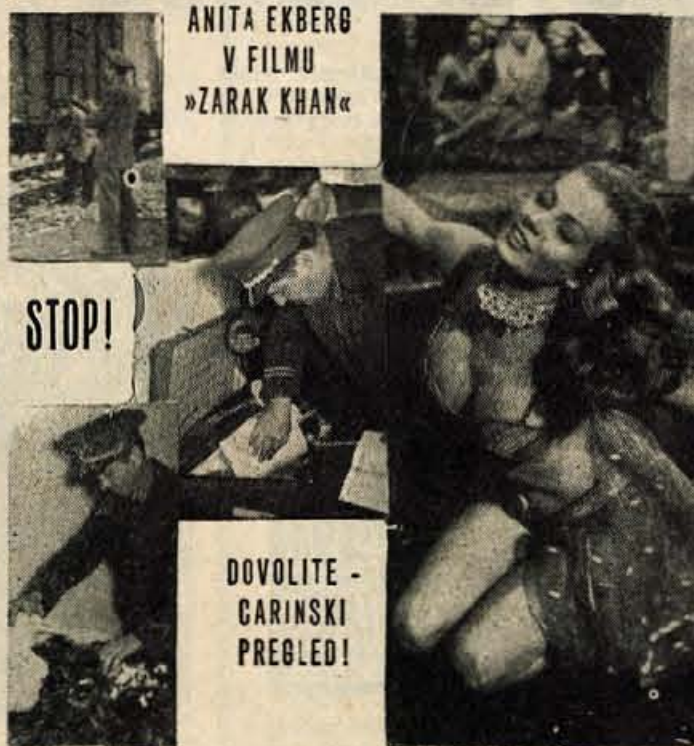
ANITA EKBERG V FILMU »ZARAK KHAN«