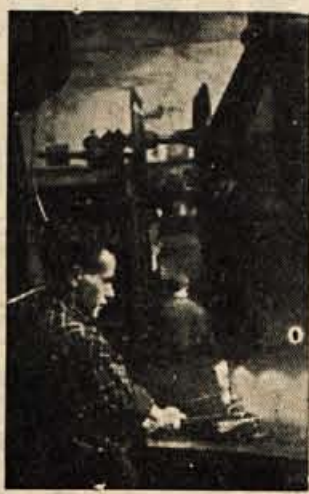
PRI DELU Kroparski žebjar

Na včerajšnji mladinski konferenci obrata LIP v Kamnem so obravnavali vrsto vprašanj, ki žulijo mladinsko organizacijo in ji onemogočajo uspešnejše delo. Po izbrnem referatu se je pričel večje število diskutantov, ki so se zadržali zlasti pri kulturno prosvetnih