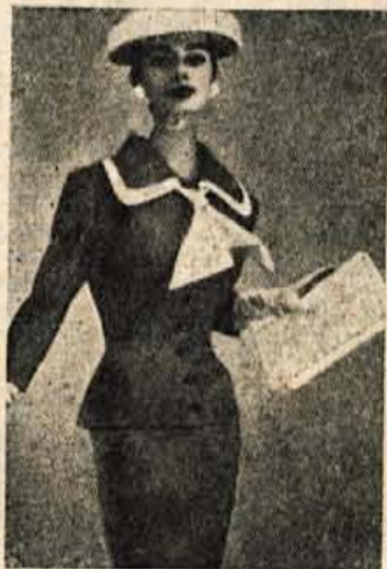
Oprijet kostim z belo pentljo in belim dodatkom na ovratniku za sončne pomladne dneve