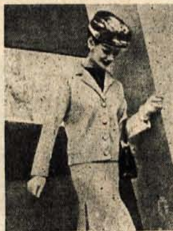
Svetel pomladanski komplet z ravno krojeno jopico

Kar smo naškrobili, moramo tudi pravočasno zlikati. Če naškrobljeno perilo leži nekaj dni, splesni, plesen pa je najhujši sovražnik tkanin.