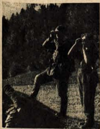
JLA čuva tradicije NOB

Vsekakor je treba pogledati stvari globlje v bistvo. Vojna tehnika ima v armadi neslutene razvojne možnosti, zato se ni bati strokovnega nazadovanja. Oficirja, ki konča vojno akademijo, se prizna fakultetna izobrazba, ali pa dobi zvanje inženirja, v kolikor gre za absolventa tehniške akademije. Mimo tega so tudi materialni pogoji, ki jih stariši v mnogih primerih ne morejo nuditi svojim sinovom, rešeni v armadi na zelo ugoden način. V navadi je, da so stariši zelo ponosni, če postane sin inženir, doktor, profesor itd., še ponosnejši pa so, če imajo sina — oficirja JLA. Zato je dolžnost slehernega državljana naše domovine, zlasti pa rezervnih oficirjev, da vzgajajo svoje sinove v ljubezni do vojaškega poklica v JLA. M. Vukovič