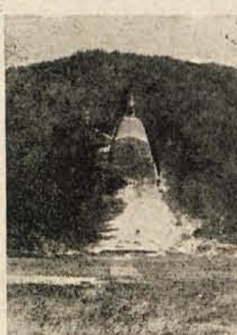
»MAMUTSKA« V PLANICI

Kranj, 24. februarja. Danes je bilo v dvorani pri tovarni »Savi« v Strazišču ekipno okrajno strelsko prvenstvo z rračno puško za člane in članice. Tekmovali so v 5-članskih ekipah v stoječem položaju. Skupno je nastopilo 28 moških in 7 ženskih ekip. V zelo hudi konkurenci so zmagali tržiški strelci s 650 krogi. pri članicah pa streлке z Jesenic s 613 krogi od 750 možnih.