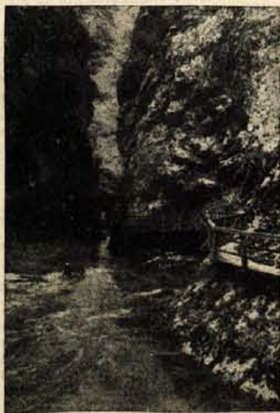
SOTESKA VINTGAR — »MEKA« TURISTOV

Med mnogimi krasotami naše slovenske zemlje je Vintgar med prvimi. S svojo romantično lepoto prekaša po zatrdju domačih in tujih očividcev podobne soteske v Avstriji, Tirolski in Švici. Razlika je le v tem, da znajo drugi narodi vse drugače kot mi izkoristiti svoje naravne lepote.