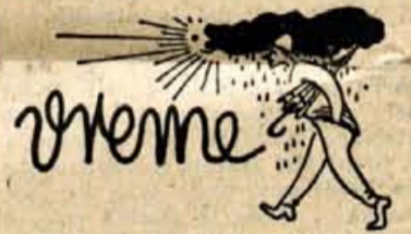
Nekaj dni še jasno in sončno vreme, v drugi polovici tedna snežne padavine. Kasneje občuten padec temperature.