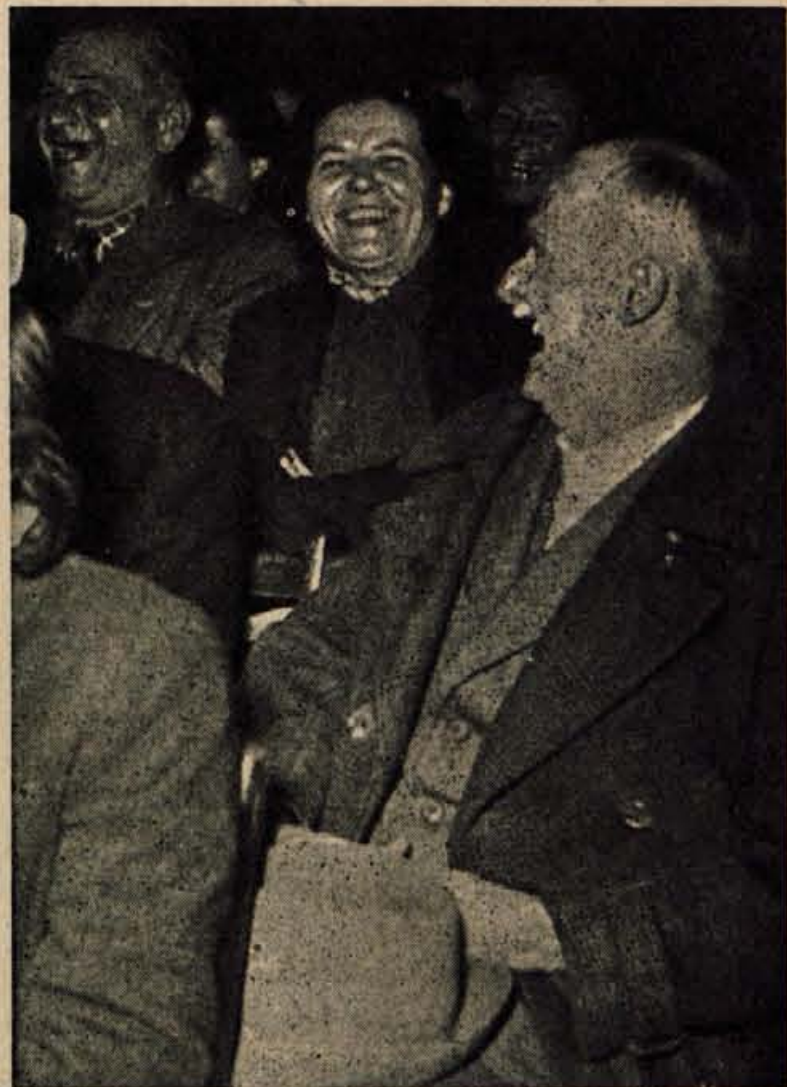
USTNI ČASOPIS V BOHINJSKI BISTRICI

Se vedno je boleča točka naše mladine v podjetjih, da ne sodelujejo dovolj pri delavskem samoupravljanju. Iz razgovora z mladinci se večkrat opaža, da ne poznajo načina upravljanja (Nadaljevanje na 2. strani)