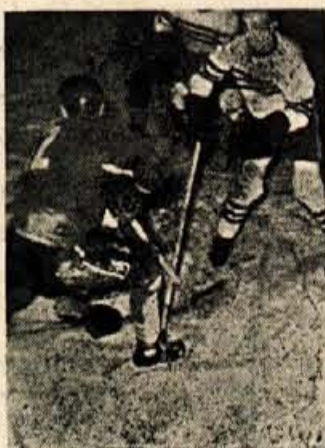
Gneča na ledu