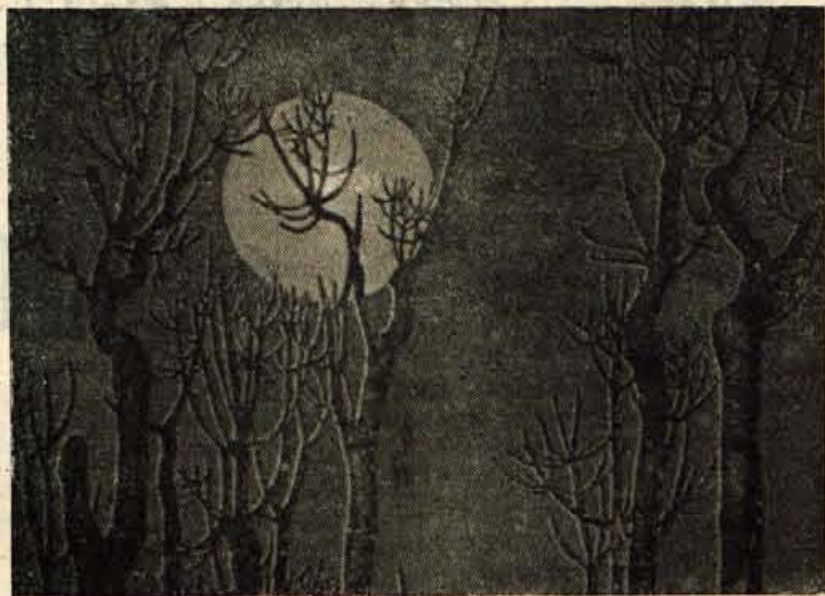
BOJAN GOLJIA: UJETI MESEC (LESOREZ)