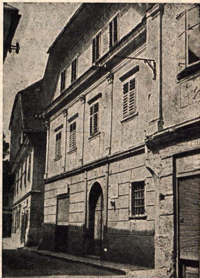
NA LINHARTOVEM TRGU ŠT. 7 V RADOVLJICI STOJI HIŠA ZA VZIDANO MARMORNO PLOŠČO, NA KATERI PIŠE: »TU JE BIL ROJEN 11. XII. 1756. LETA ANTON TOMAZ LINHART, ZGODOVINAR IN DRAMATIK.«

Kolikšnega pomena sta za našo kuzliževnost zlasti njegovi deli »Zupanova Miska« in »Matiček« ni treba ponavljati. Zadostuje le, če prisluhnemo Prešernu, ki pravi, da mu bodo Muze čast izkazovale, dokler bo slovenstvo žive.