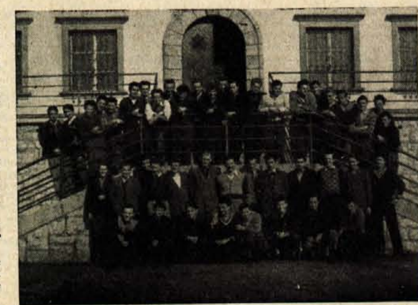
PO USPEŠNEM SOLANJU Kmetijska šola Poljče je nudila že mnogim tečajnikom praktično znanje