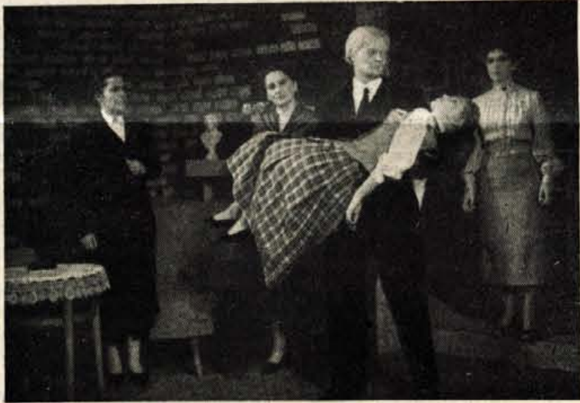
»VISOK JE ZID«

Morda utegne kdo ugovarjati, da film ni na tisti tehnični višini, kakršno smo vajeni dandanes, vendar moramo upoštevati, da je družba 20. Century Fox posnela ta film po istoimenskem romanu Jacka Londona pred dvajsetimi leti. Kljub temu pa moramo filmu priznati nekatere kvalitete, pa tudi to, da se je režiser William Hellman dokaj zvesto držal Londonove literarne predloge in hkrati v prizorih s psi zelo efektivno izoblikoval misel o praganou psa-voška. — Simpatični Clark Gable in ljubka Loreta Young nas v zgodbi popeljeta med love in skalce zlata na visoki ameriški sever, standardnemu srednemu koncu pa se izogneta. Tega si lahko priproji vsak gledalec sam po lastnem okusu. O ostalem: igra, fotografija in ostalih plach režije pa presodite sami! —aa—