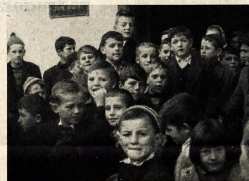
VESELI IN ZACUDENI OBRAZI

Posnetek z nedeljske otvoritve mladinskega kina na Primskovem