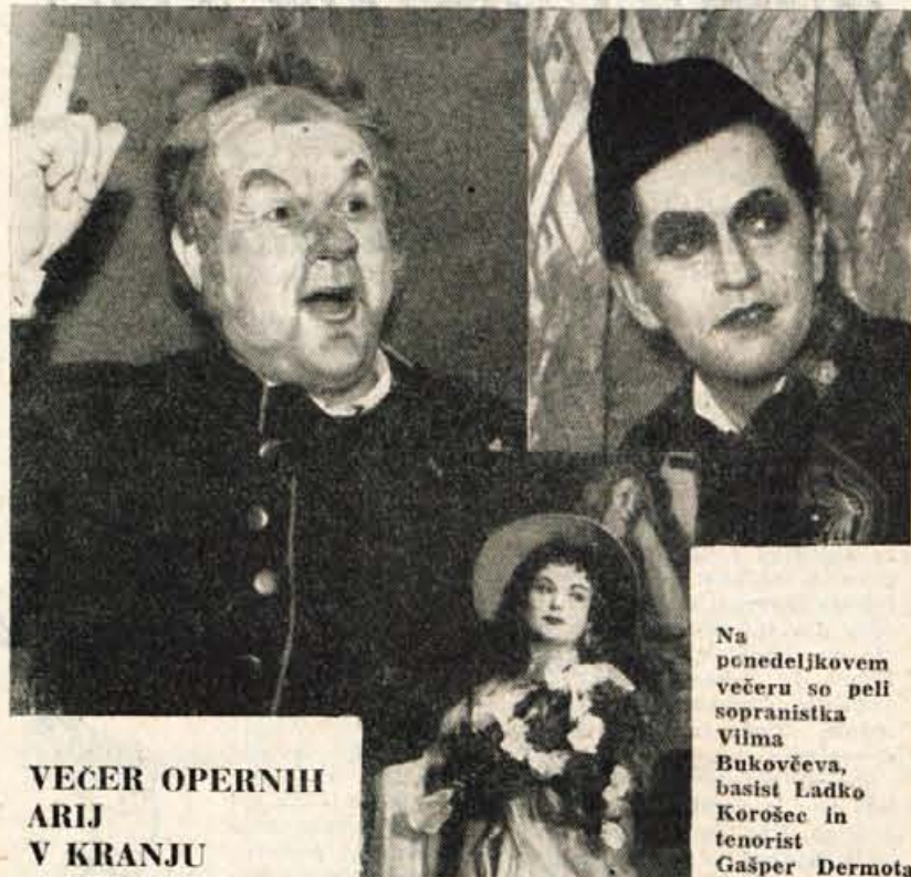
VECER OPERNIH ARIJ V KRANJU