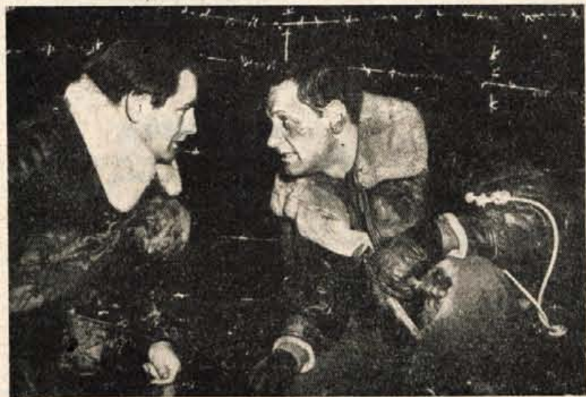
DVA POSNETKA IZ DVEH FILMOV, KI BOSTA V PRIHODNIH DNEH NA SPOREDU V KRANJU IN DRUGOD PO GORENJSKI: ZGORAJ IZ ANGLEŠKEGA FILMA »STALAG 17« — DESNO PA IZ FRANCOŠKO-ITALIJSKEGA BARVNEGA FILMA »LUCREZIA BORGIA« Z MARTINE CAROL V NASLOVNI VLOGI