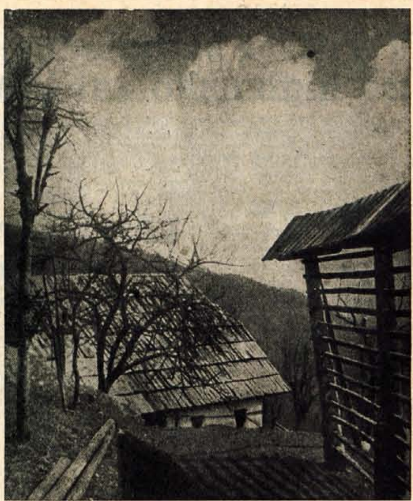
KOZOLCI SO PRAZNI, DREVJE SE JE OBLETELO, SONCE NE MORE VEČ OGRETI ZEMLJE, KI ČAKA SNEGA

Ti podatki veljajo za vso državo, medtem ko je pridelki v nekaterih republikah tudi večji od lanskega.