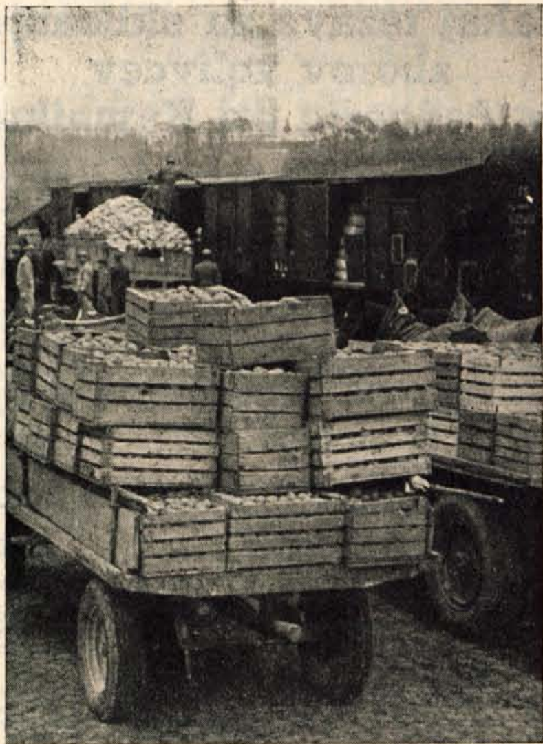
ZIMSKE SKRBI Na železniškem kolodvoru v Kranju nakladajo krompir

stavljal pri veliki tekstilni stavki v Kranju. »Seveda moje delo ni bilo brez težav. Mnogokrat so me hoteli sovražnik s silo zadržati. Saj sem bil šestkrat aretiran, sedemkrat pa sem ušel. Ko sem 24. junija 1942. leta govoril na shodu v Dvorski vasi in javno kritiziral narodna izdajstva, sem si tako rekoč sam podpisal smrtno obsodbo, saj me je takrat poslušalo tudi okoli 200 belogardistov. 8. avgusta sem bil v Velikih Laščah celo obsojen na smrt. Toda — izmaknil sem se. Potem so me pošiljali iz taborišča v taborišče. Nisem jadtakoval,« je ponosno pri-