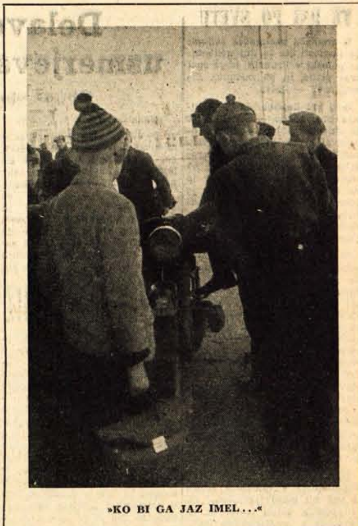
»KO BI GA JAZ IMEL...«

Izdaja: Gorenjski tisk / Ureja: Uredniški odbor / Odgovorni urednik: Slavko Beznik Telef. uredništva 475 — uprave 190 / Tekoči račun pri NB Kranj št. 61-KB-1-2-135 / Izhaja v ponedeljek in petek / Naročnina: letna 600, polletna 300, mesečna 50 dinarjev.