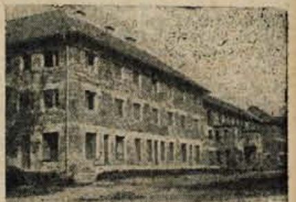
ZIRI Nov zadržni dom