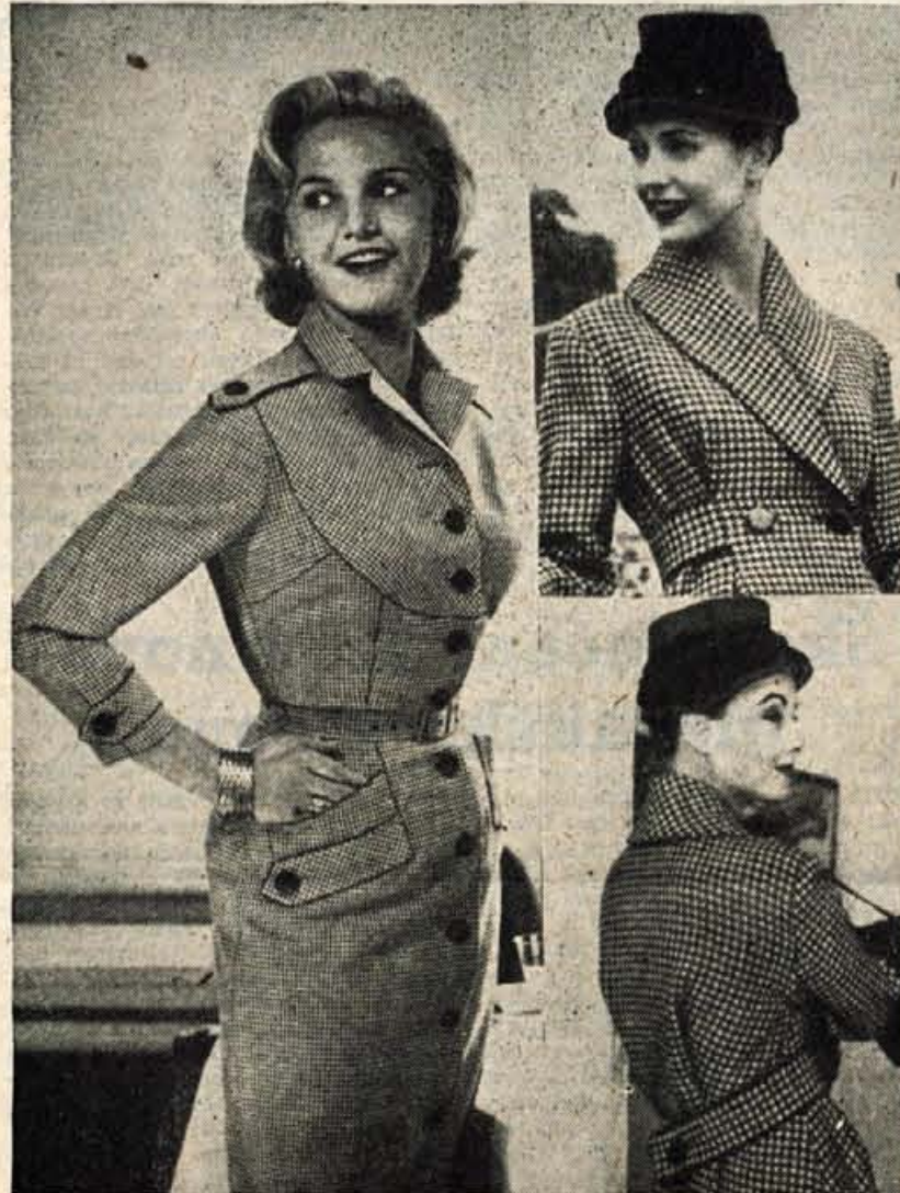
MLADOSTNA SPORTNA OBLEKA IZ ČRNO ALI RJAVO-BELE PEPITA TKANINE JE NADVSE PRIMERNA ZA DELO V PISARNI ZAPENJA SE Z VELIKIMI GUMBI V TEMNEJSI BARVI OD VZORCA, VOLNOVNO PEPITA BLAGO SI LAHKO OMIŠLITE TUDI ZA PLAŠČ, KOT GA VIDITE NA SLIKI. PAS JE V SLOGU ZADNJE MODE SPREDAJ ZVISAN, ZADAJ PA SE V LEPEM LOKU SPUSČA IN ZAPENJA V NORMALNI LEGI