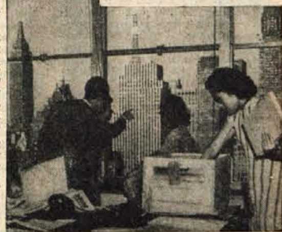
ZGORAJ: PROČELJE VELIKE PALAČE JE 17. MODREGA STEKLA. PRED PALAČO JE ČUDOVITI »VODOMET MLADOSTI«. — SPODAJ: NOVA PALAČA OZN STOJI V ČETRTI NEBOTIČNIKOV IN SKOZI OKNA PALAČE JE LEP POGLED NA NAJVIŠJE STAVBE NA SVETU