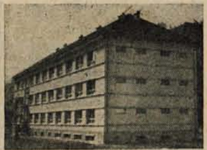
ZIRI Nova šola

Kaj pa zdaj? Ogledati sem si hotel Ziri iz bližje perspektive. Zavil sem iz vasi v strmo pobočje Zirka. Počasni sem se vzpenjal navkreber in razpredel misli, ki so se mi vsiljevale po končanih pomenkih. — Zdajci je v rebri nad menoj močno zašumelo. Uzrl sem možakarja, ki je spretno krmaril ogromno grmado dračja po strmih pobočju v dolino. Gledal sem, kaj ima pod grmado, da tako hitro drsi, pa nisem opazil drugega kot veliko vejo, ki je služila za sani. Vsekakor hvalevredna domiselnost!