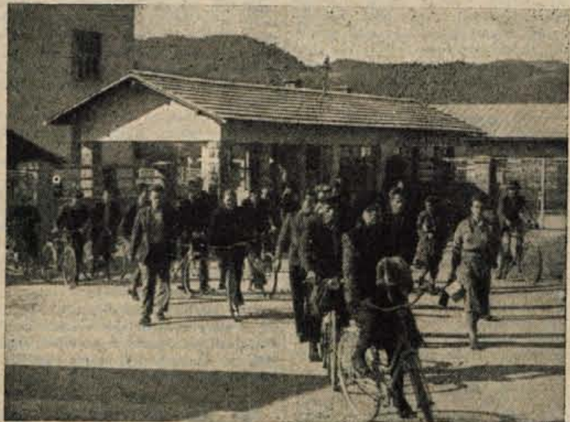
ZIRI Delavci odhajajo iz tovarne »Alpina«

Grmado dračja se je zazibala in jela drseti v dolino.