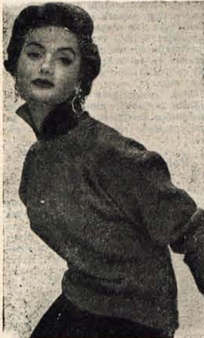
Eleganca in praktičnost, oboje je združeno v puloverju, ki ga prikazuje slika. Navodila za pletenje si preberite v sestavku »Sama si bom spletla pulover«.

Zelje ozimimo najlaže. Popolnoma razvite trde glave postavimo s kocenom vred v pesek ali v zemljo drugo poleg druge, lahko pa kocen odrežemo in zložimo glave na polico. Na ta način se drži zelje ali ohrovt le do februarja, sicer pa ga pri toploti 1 do 2 stopinje Celzija obdržimo do marca. Najbolje se drži zelje v zasipnici, kjer ga naložimo s kocenom v zrak. Pozno zelje pustimo jeseni čim dalje na vrtu.