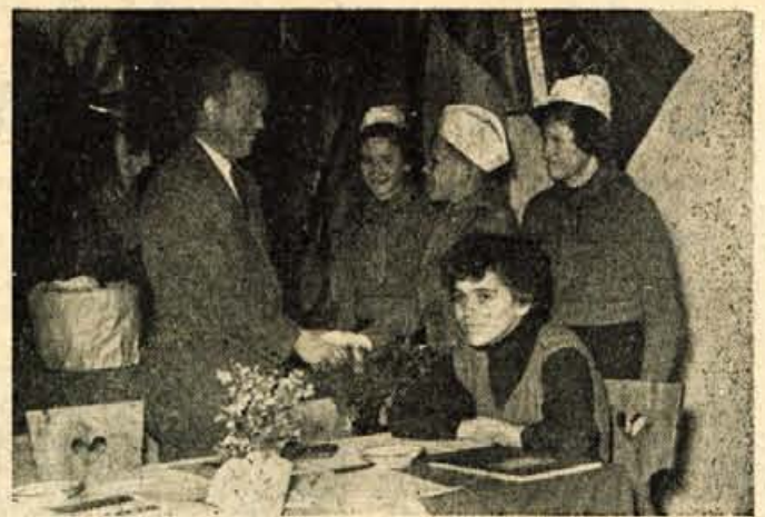
Pionirji iz Predoselj pozdravljajo občni zbor strelske družine »Franc Mrak«.