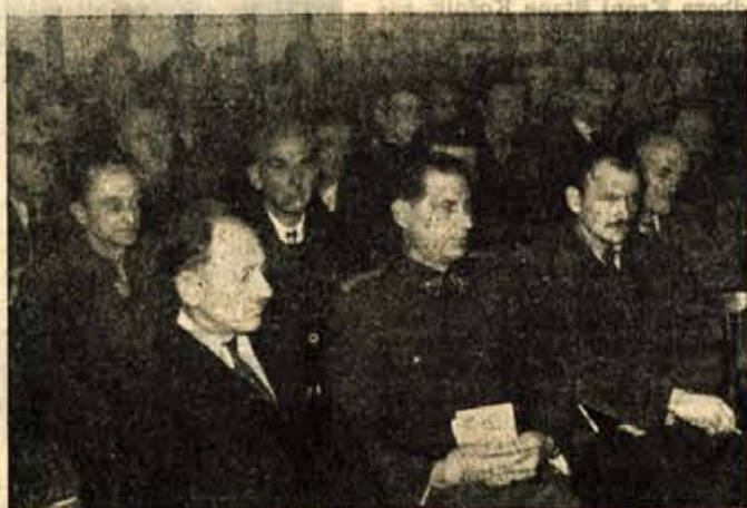
Z občnega zbora Prostovoljnega gasilskega društva Kranj

gasilci Prostovoljnega industrijskega gasilskega društva »Iskra« iz Kranja. Medtem ko so bili na občnem zboru poročevalci bolj skromni s svojimi poročili, je bila razprava toliko bolj