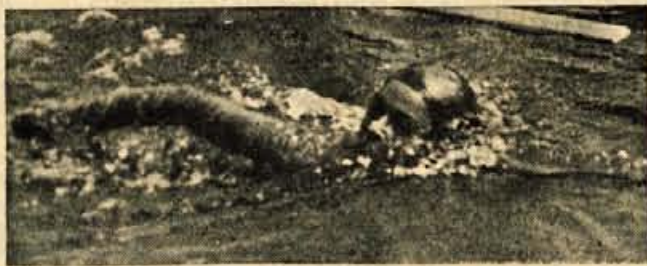
Koncilijeva Barbka je še vedno najhitrejša

(5:24,7). Prešeren, ki je letos zamenjal lanskega četroplosiranege, Bled, se je močno približal II štafeti Triglava.