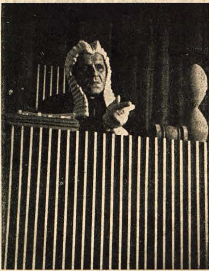
SE BO SIJALO SONCE

V organih delavskega in družbenega upravljanja si mora mladina svoje mesto priboriti, je med drugim poudaril tovariš Perovšek. Mlada generacija mora biti pripravljena pomagati pri vseh težavah in (Nadaljevanje na 2. strani)