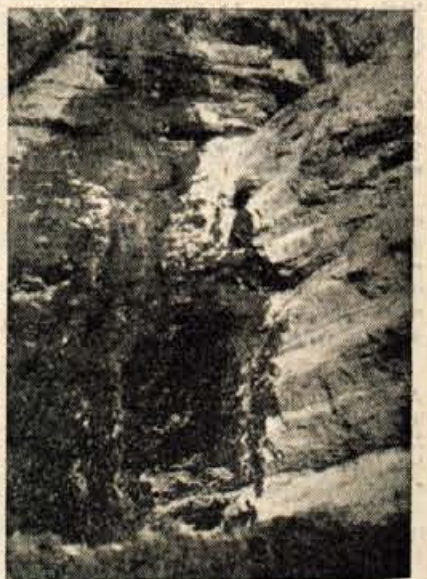
VELIKI SLAP SAVICE JE USAHNIL