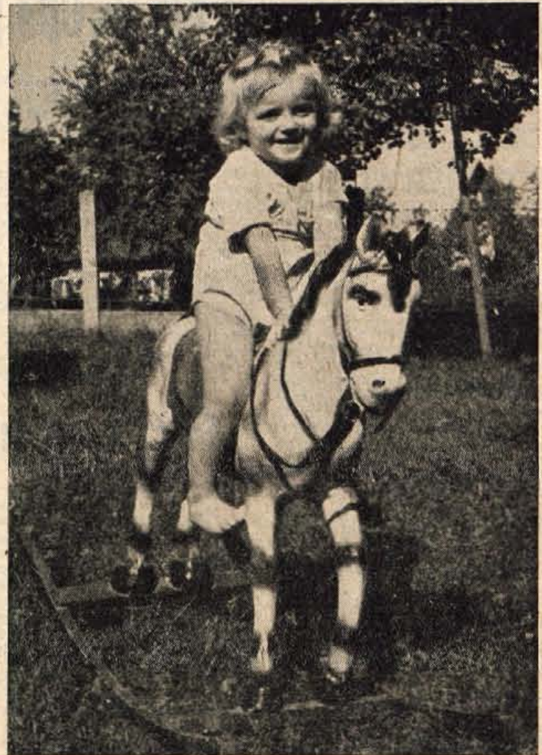
TUDI ONA IMA BREZSKRIBNO ŽIVLJENJE