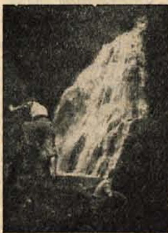
LEPOTA Slap Šumu v Besnici

Pot naju je vodila po prašni cesti proti Joštu in Rakovici. Ves čas mi