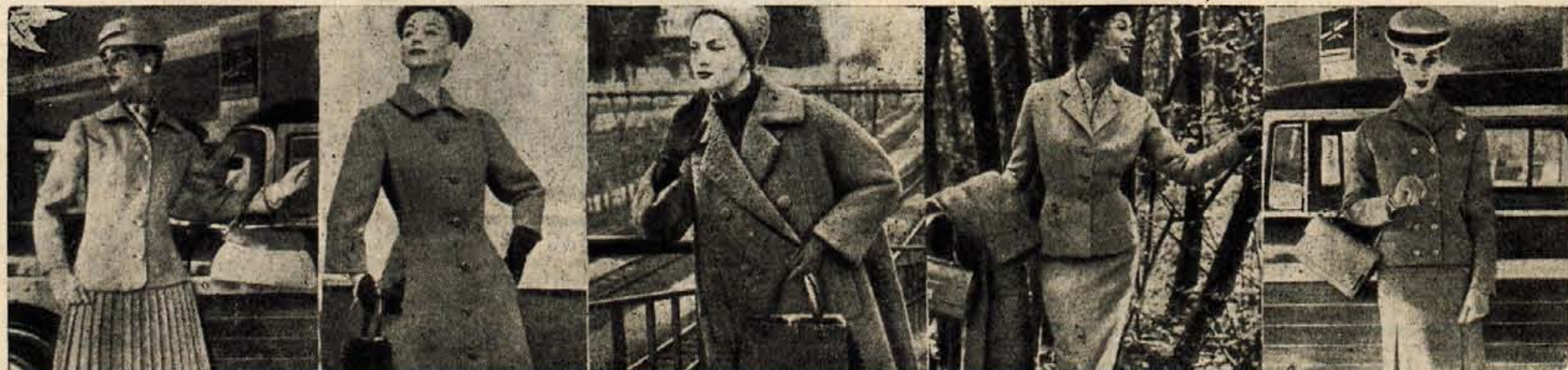
ZA VSAKO NEKAJ! — Revija jesenskih modelov plaščev in kostimov, k' jih odlikuje enostavnost kroja

Ličila zanje mora vedno ustrezati barvi vaše polti in las. Črnolasa žena s temno poltjo naj uporablja temno karminasto — rdečo barvo z vijoličastim odtenkom. Živa, oranžnordeča ličila smejo uporabljati poletni zagorele rjavolaske, plavalase žene pa naj uporabljajo rožnata, svetla ličila, lahko z vijoličastim odtenkom.