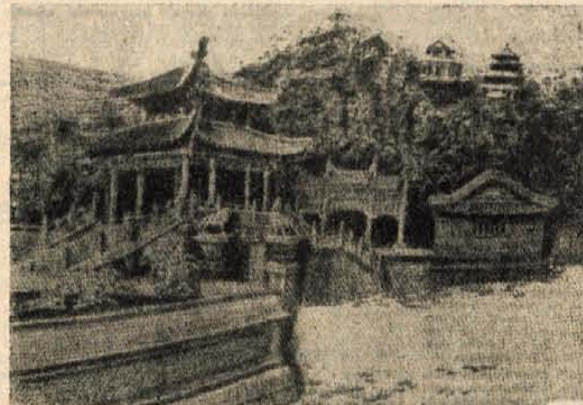
Plastični relief stare dvorske palače v Pekingu, izdelan iz plute. S to umetno obrtjo se pečajo prebivalci pokrajine Fukjen. Pluto najprej drobno narežejo in zatem sestavijo podobe z izredno perspektivnostjo in vsami podrobnostmi

Zemlja je bila v lasti veleposesnikov. Teh je bilo v vasi 45. Za naše pojmovanje bogastva bi bili ti »veleposesniki« s 3 ha zemlje smešni. Kitajska merila so drugačna. Tu je siromašna družina imela samo 2 muo zem-