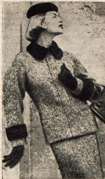
ZA OKRAS KRZNO

Ravno krojen kostim iz tweeda s krznem ovratnikom in manšetami