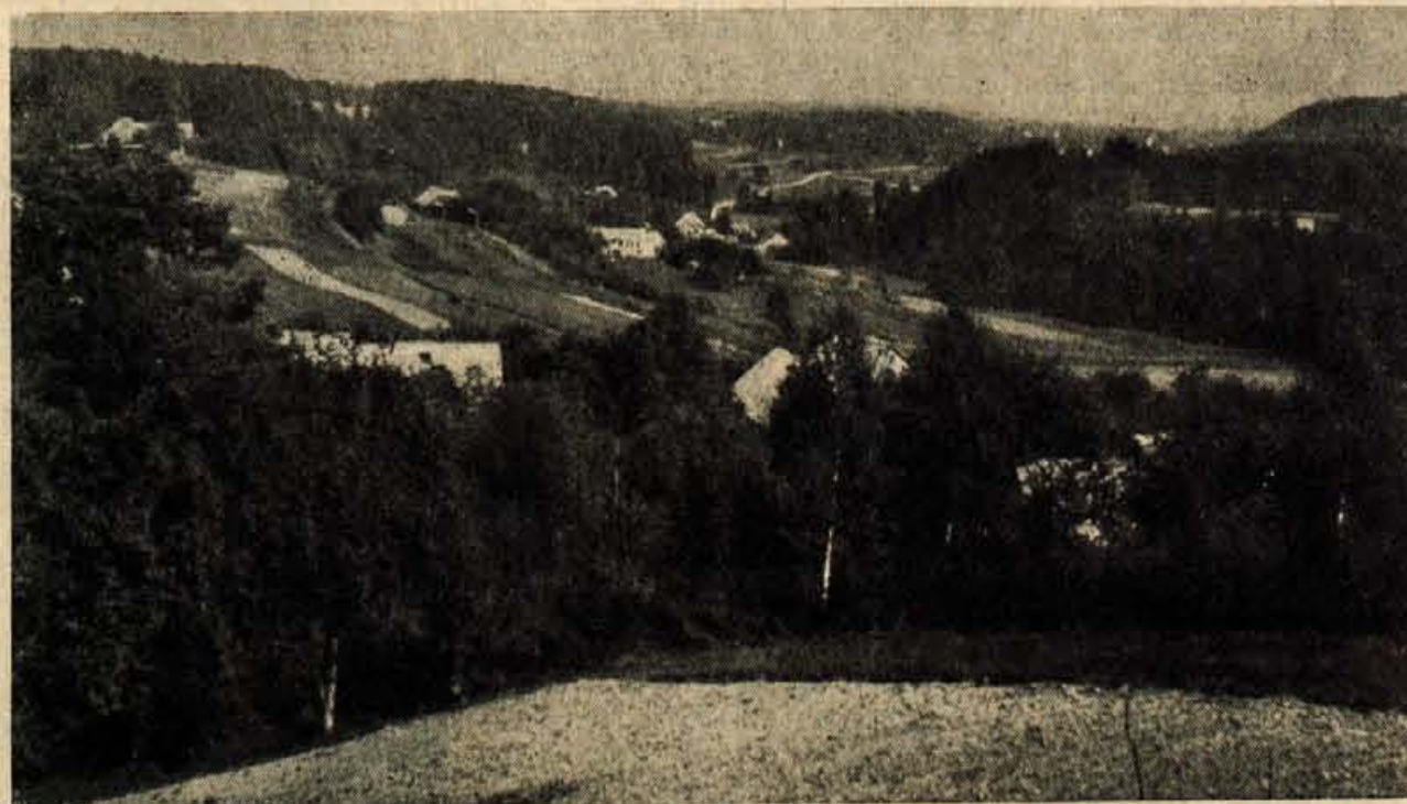
Pogled na Besnico (Berite reportažo na 4. strani!)

Mladinski teden se bo začel v soboto ob 17. uri s svečano sejo Občinskega komiteja LMS Kamnik. Glavne prireditve v nedeljo bodo tekmovalne pionirjev s skiroji, polževe dirke in tek v vrečah na trgu ter veliko mladinsko zborovanje na Duplici s kulturnim programom. V teku tedna bodo imeli pionirji strelska tekmovanja, šahovski brzoturnir, nogometne tekme in medšolske atletske prireditve. Tudi mladinci se bodo pomerili v vseh športnih disciplinah, mladi alpinisti in taborniki pa bodo še na Mali planini počastili spomin na V. konferenco SKOJ. Med kulturnimi prireditvami bo en večer posvečen materam in svojem padlih borcev Kamniško-zavavskega odreda; v veliki dvorani »Doma« pa bo uprizoritev trodejanke »Noč v plamenih«. Gostoval bo tudi orkester tovarne »Melodije« iz Mengša.