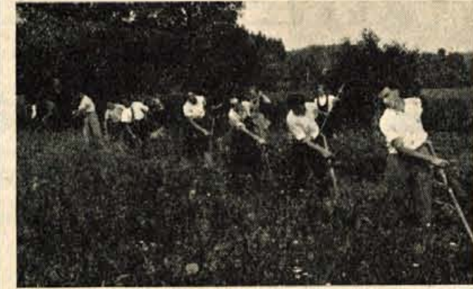
Tekmovalje mladih koscev v Naklem

Po podelitvi pokalov in diplom so zastopniki imeli skupno zakusko.