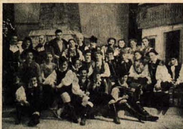
»Plavže na odru v Podnartu«

amaterskih druščin tudi monopolizem posameznih »krogov«, ki si v nekaterih krajih vzamejo dramatiško v zakup. Tako delo ne vodi nikamor, kvečjemu v sektaštvo, kjer se ljudje usposabljujejo predvsem za kovanje zdrab in drugih nečednosti, ki ni-