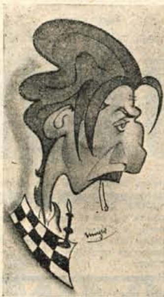
Po zmagi v Mariboru, še ena na Rabu

Gorenjski okrajni šahovski odbor je s šahovskim društvom Kranj organiziral od 5. do 17. septembra »Spominski šahovski turnir na Rabu« v počastitev žrtve fašizma rabskega taborišča. Ze četrtič so se zorali šahisti iz vseh predelov Slovenije, to pot tudi šahisti iz Hrvaške z željo, da bi postal ta turnir tradicija ne samo slovenskih šahistov, pač pa da bi se vključili v to turnirje šahisti vsch republik, s čemer bi najdoslejnejše počastili spomin žrtve.