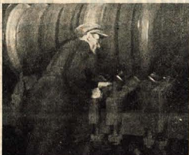
Delavec v jeseniški železarni

TE DNI POTEKA v New Yorku konferenca 82 dežel, ki ima namen zblizhati stališča in sprejeti sklepe o mirnodolski uporabi jedrske energije. Ta sestanek je sicer nekoliko v senci pozornosti svetovne javnosti. Nekateri so bili celo mnenja, da ta konferenca nima pravega pomena spriko splošne zaostrišne mednarodnega položaja, katero je povzročila sueska kriza. Toda konferenca poteka, in upamo lahko, da bo v marsičem zblizala temeljna gledišča zlasti med veslellami v katerih je atomska znanost najbolj napredovala — ZDA, Velika Britanija, Sovjetska zveza, Kanada in Francija — in med vsemi drugimi državami na svetu.