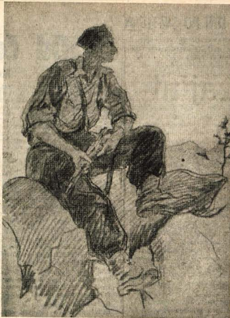
BOŽIDAR JAKAC: NA STRAZI