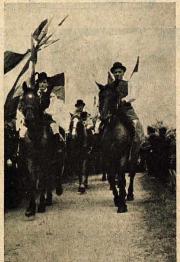
V NEDELJO (8. VII. 1956) — »Kmečka očet« v Bohinju