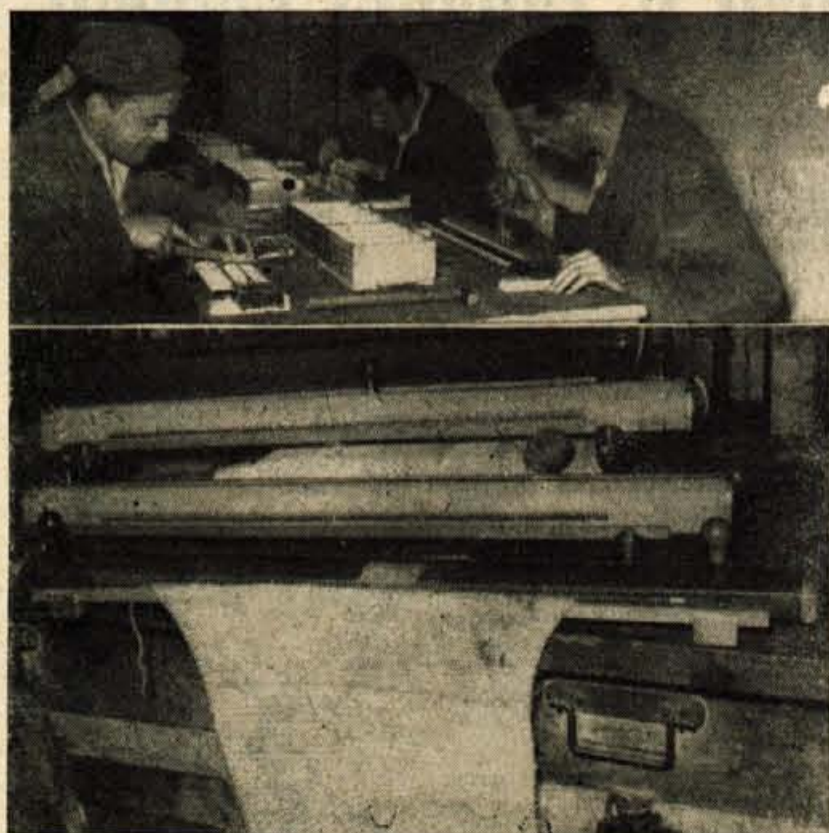
Zgoraj: PRI SESTAVLJANJU DELOV PLETILNIH STROJEČKOV Spodaj: PRVI STROJI SO GOTovi

To novo vejo svoje proizvodnje si bo skušalo podjetje čimprej osvojiti. Da